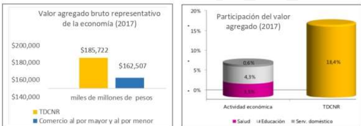
Figura 1 . Valor agregado y participación del PIB del TDCNR