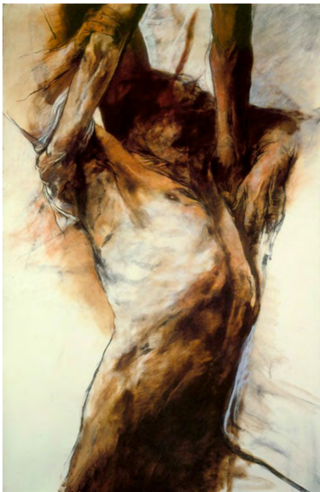
Figura 4. Luis Caballero. Sin título (1984)

Nota. Óleo, sanguina y pastel sobre papel. 190 x 120 cm.