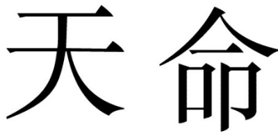
Figura 2. El mandato del cielo.

El mandato del cielo se refiere a una concepción natural del Tian , cuyo papel es el origen de la legitimidad del político. En la China imperial el “mandato del cielo” actuó como modelo de gobierno. No obstante, en el caso chino, a pesar de que se tiene una estructura de poder imperial forjada de la mano del emperador, la legitimidad funciona de otra manera, ya que no existe un poder absoluto del emperador a pesar de la relación jerárquica y vertical que ejerce (León de la Rosa, 2015).