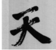
Figura 1. La conjugación de la conexión entre cielo, tierra y hombre da como resultado la armonía social.

Antes de retomar la propuesta del Tianxia, es necesario analizar su terminología como así también su estructura y escritura. El sistema de escritura china está formado por miles de caracteres (llamados en chino hànzì ), que se han utilizado durante miles de años. El carácter Tian significa cielo o naturaleza, y hace referencia a la naturalidad en una escala divina. El papel del Tian es legitimar a los soberanos.