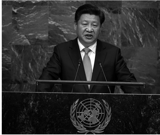
Figura 4. Xi Jinping pronunciando su discurso en el debate general de la sesión 70 de la Asamblea General de la Organización de las Naciones Unidas (ONU) en la sede de la ONU, Estados Unidos, el 28 de septiembre del 2015 (Xinhua/Pang Xinglei).

Fuente: (“Xi Jinping y su era I”, 2017).