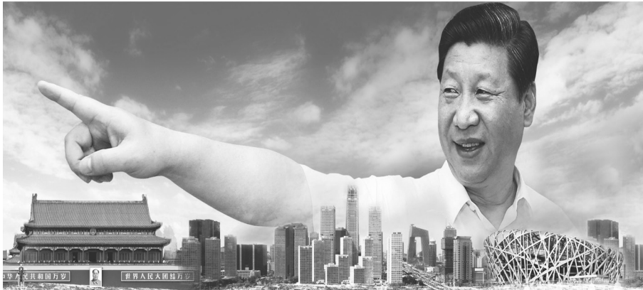
Figura 5. Xi Jinping y el sueño chino. Un crecimiento que busca plataforma mundial.

Fuente: (“Xi Jinping y su era I”, 2017).