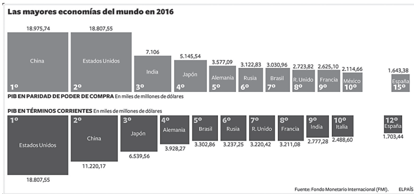
Figura 4. Las mayores economías del mundo.

los demás países y su jerarquía dominante en el conjunto de países comercialmente más desarrollados en el ámbito global.