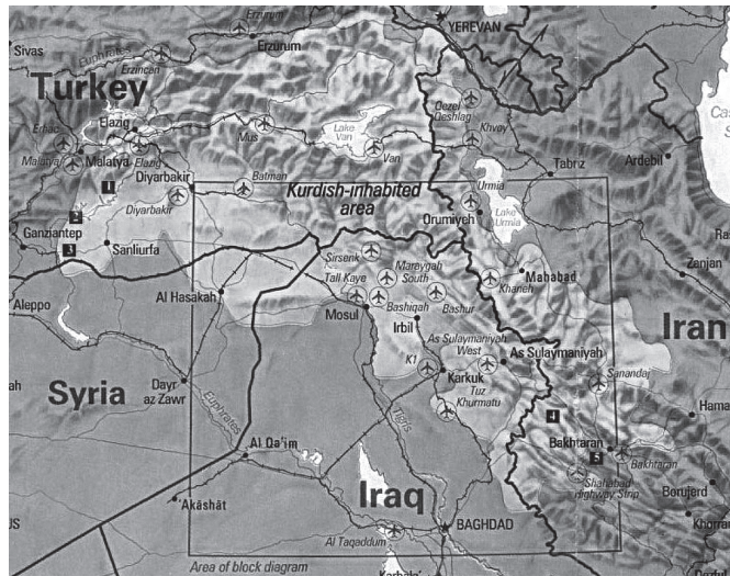
Figura 5. Kurdistán