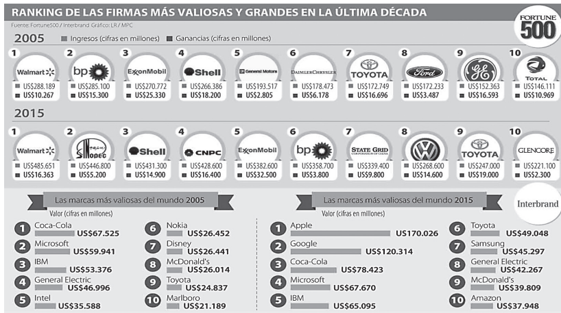
Figura 3. Ranking de las firmas más valiosas y grandes en la última década.