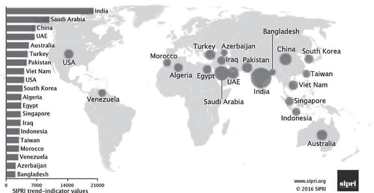
Figura 2. The 20 largest arms importers 2011-2015