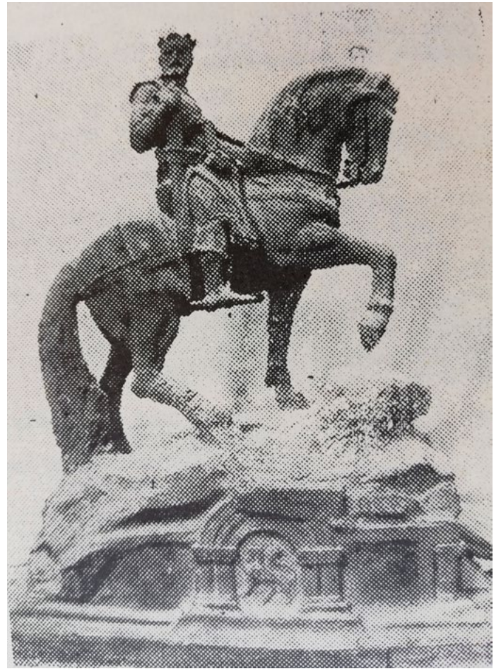
[ Figura 2. Modelo ecuestre realizado por José Bueno, 1918. ]

Fuente: José Blasco Ijazo. «Zaragoza dedicó a su conquistador don Alfonso I el Batallador un monumento en el Cabezo de Buenavista» (1948).