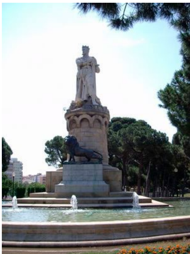
[ Figura 6. Imagen del monumento conmemorativo a Alfonso I (2019). ]