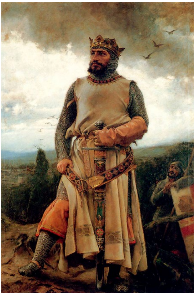
[ Figura 3. Alfonso I de Aragón. ]