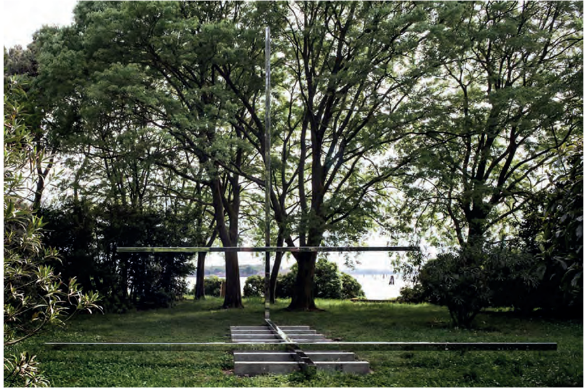
[ Foto 12. Carla Juaçaba dispone una gran cruz vertical que emerge de otra cruz paralela al suelo. Una evoca el símbolo católico y la otra se convierte en asiento. ]