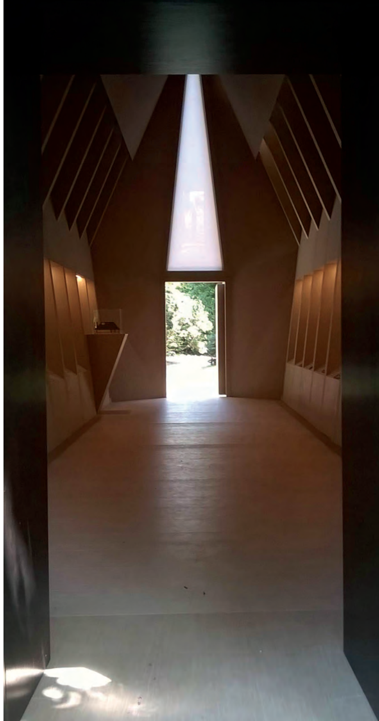
[ Foto 2. Interior de la undécima capilla de Map Studio. Alberga una exposición de los diseños originales de Gunnar Asplund. ]