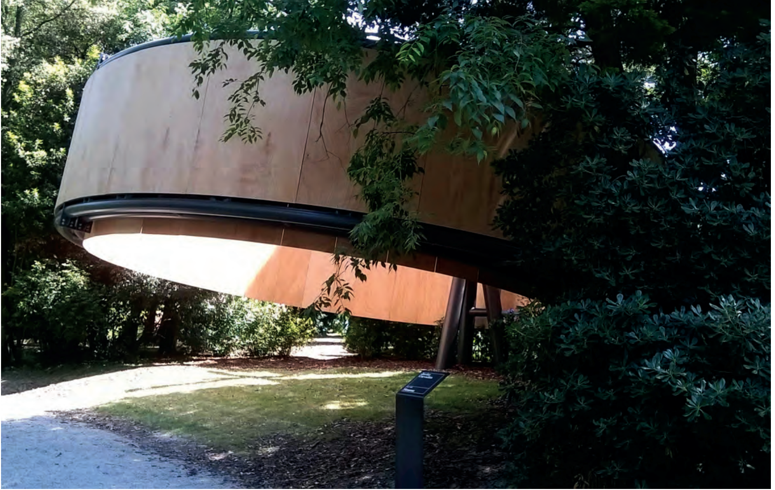
[ Foto 3. Javier Corvalán propone un gran círculo de acero suspendido, revestido en madera, en el que se encuentra una cruz tridimensional. La estructura se apoya en un solo punto. ]