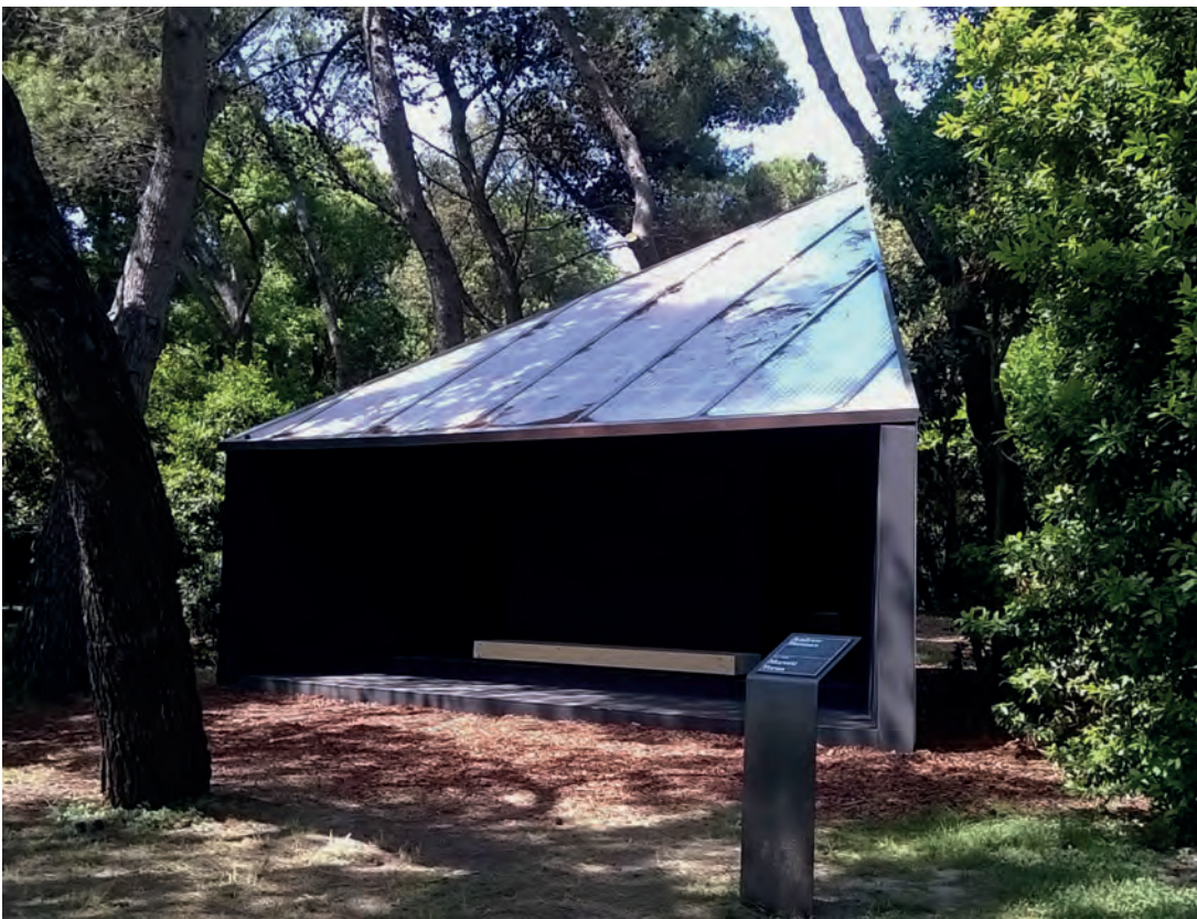
[ Foto 5. El porche de la capilla de Andrew Berman se convierte en un lugar de encuentro y de observación hacia el entorno. ]