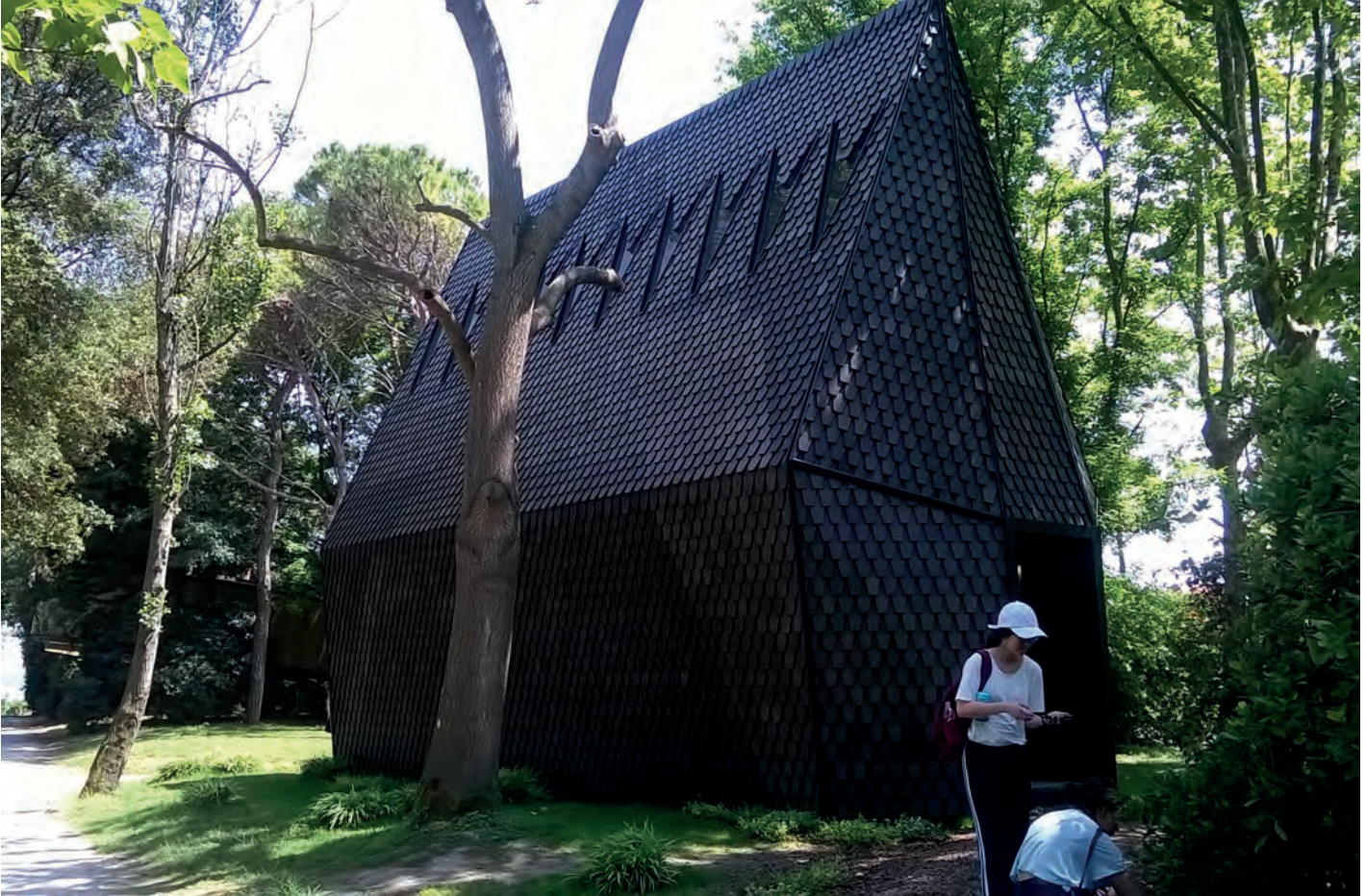
[ Foto 1. Capilla de Map Studio. La llamada undécima capilla está inspirada en las tradicionales construcciones escandinavas de madera. ]