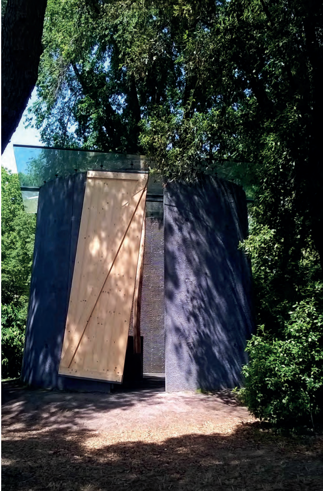
[ Foto 19. La capilla de Smiljan Radic es un cono de paredes finas, con una gran puerta de madera, y el techo cubierto por un plano de vidrio. ]