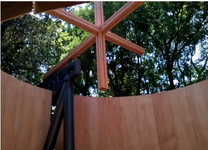
[ Foto 4. Interior de la capilla de Javier Corvalán, con la cruz tridimensional al centro del círculo. ]