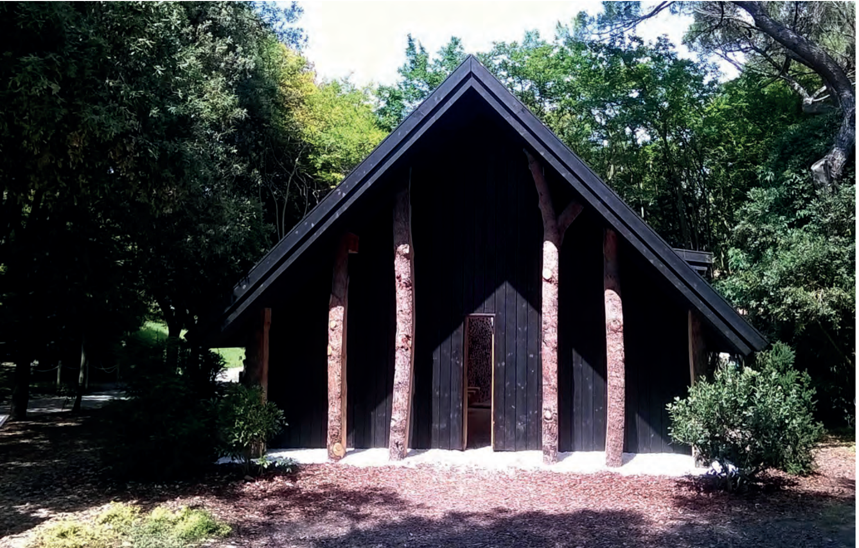
[ Foto 9. La capilla de Terunobu Fujimori es una cabaña con un porche delimitado por troncos de árboles y una estrecha puerta de entrada. ]