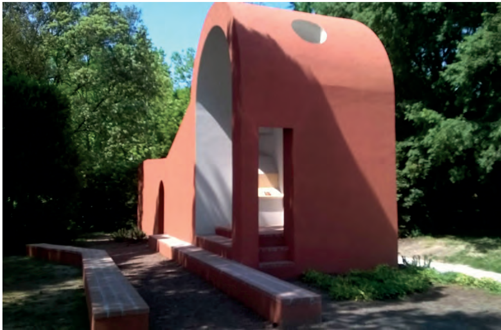
[ Foto 22. El muro que forma la capilla de Flores & Prats se curva para crear un pequeño nicho, que incorpora un atril, abierto hacia el bosque y la laguna. ]