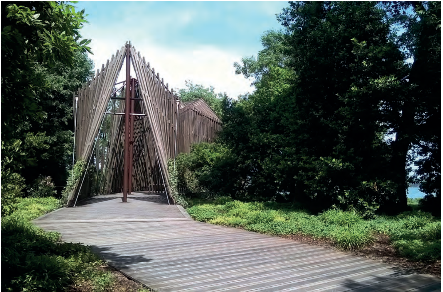
[ Foto 7. La capilla de Norma Foster cambia la dirección del camino. Se trata de una estructura de cables y puntales de acero que soportan una piel de madera. ]