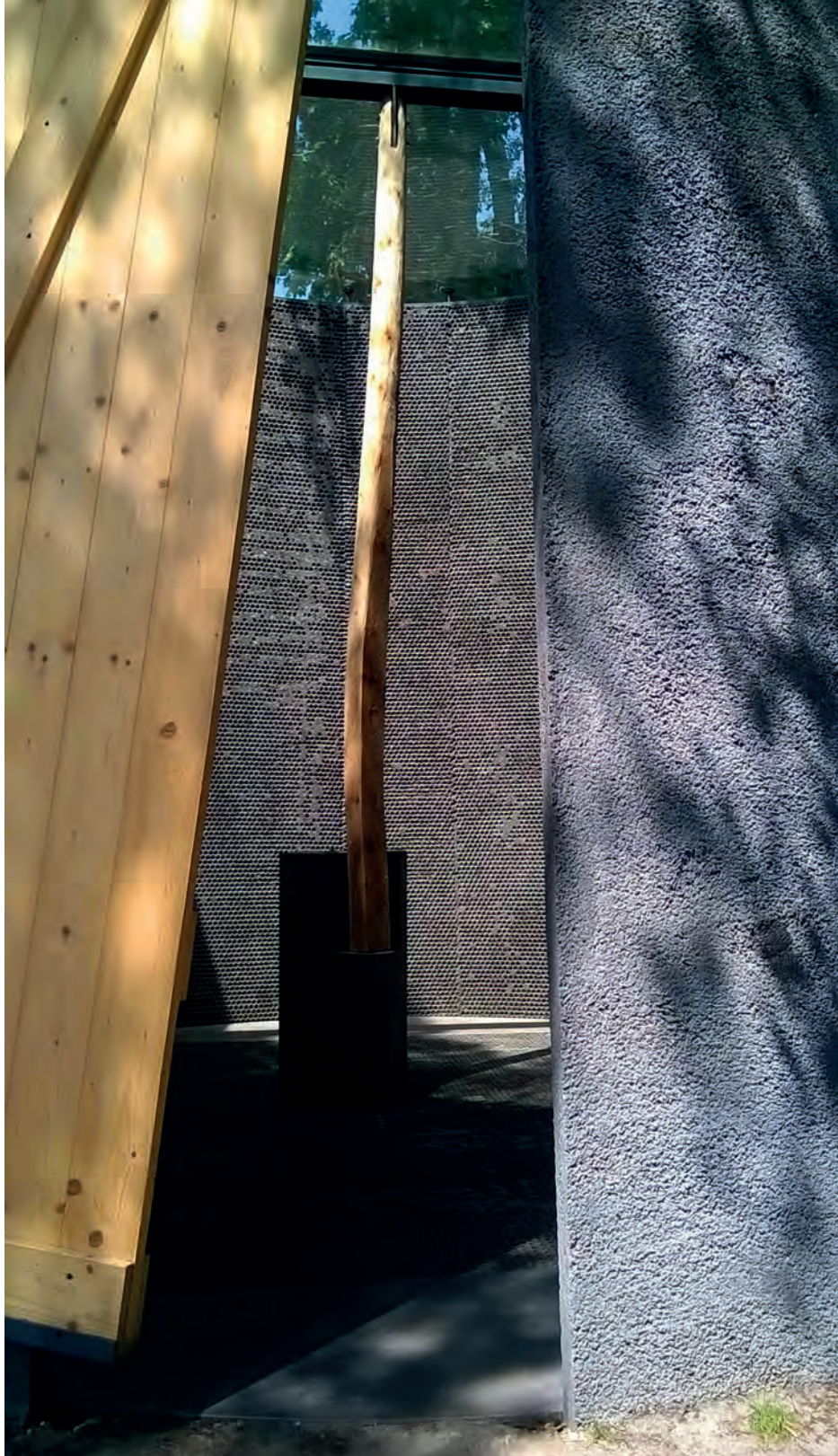
[ Foto 20. Las paredes interiores de la capilla de Radic tienen una textura muy particular porque fueron recubiertas con plástico de burbujas. ]