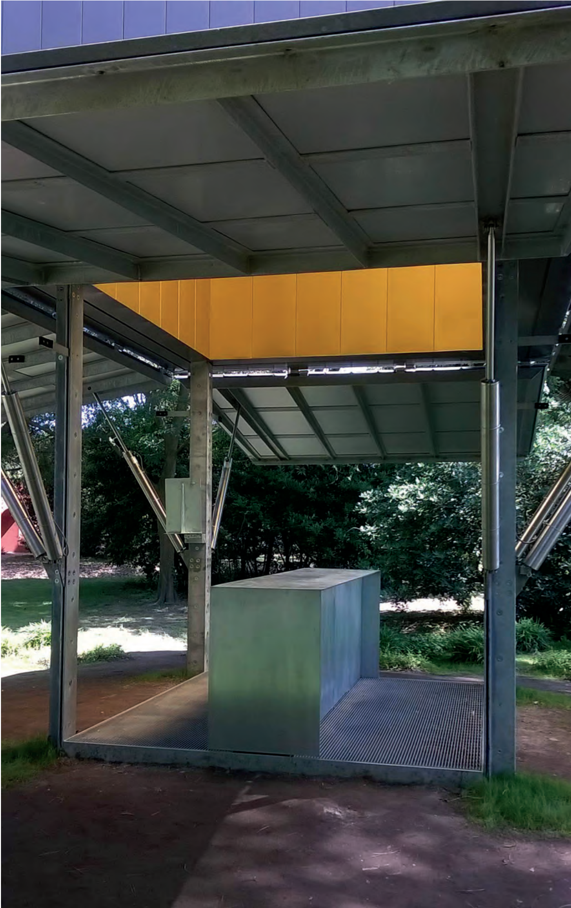
[ Foto 14. En la estructura del altar de la capilla de Sean Godsell está clavado un pequeño atril. El interior del paralelepípedo es de color dorado. ]