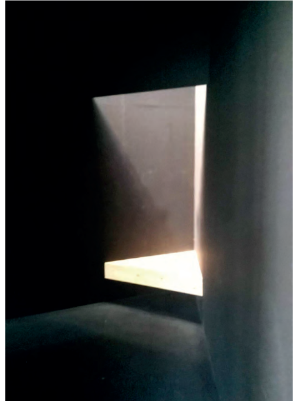
[ Foto 6. El interior de la capilla de Andrew Berman es un espacio para la introspección, con un altar de madera que apenas se ve en la penumbra. ]