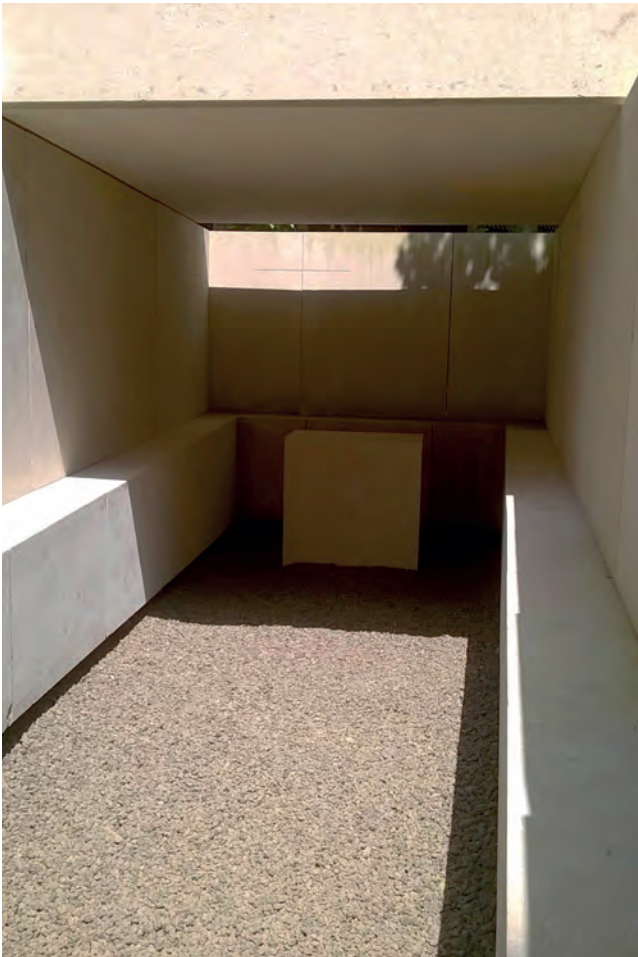
[ Foto 16. Al interior de la capilla de Souto de Moura, un banco que recorre el perímetro envuelve un sencillo altar que tiene una cruz grabada en la parte inferior. ]