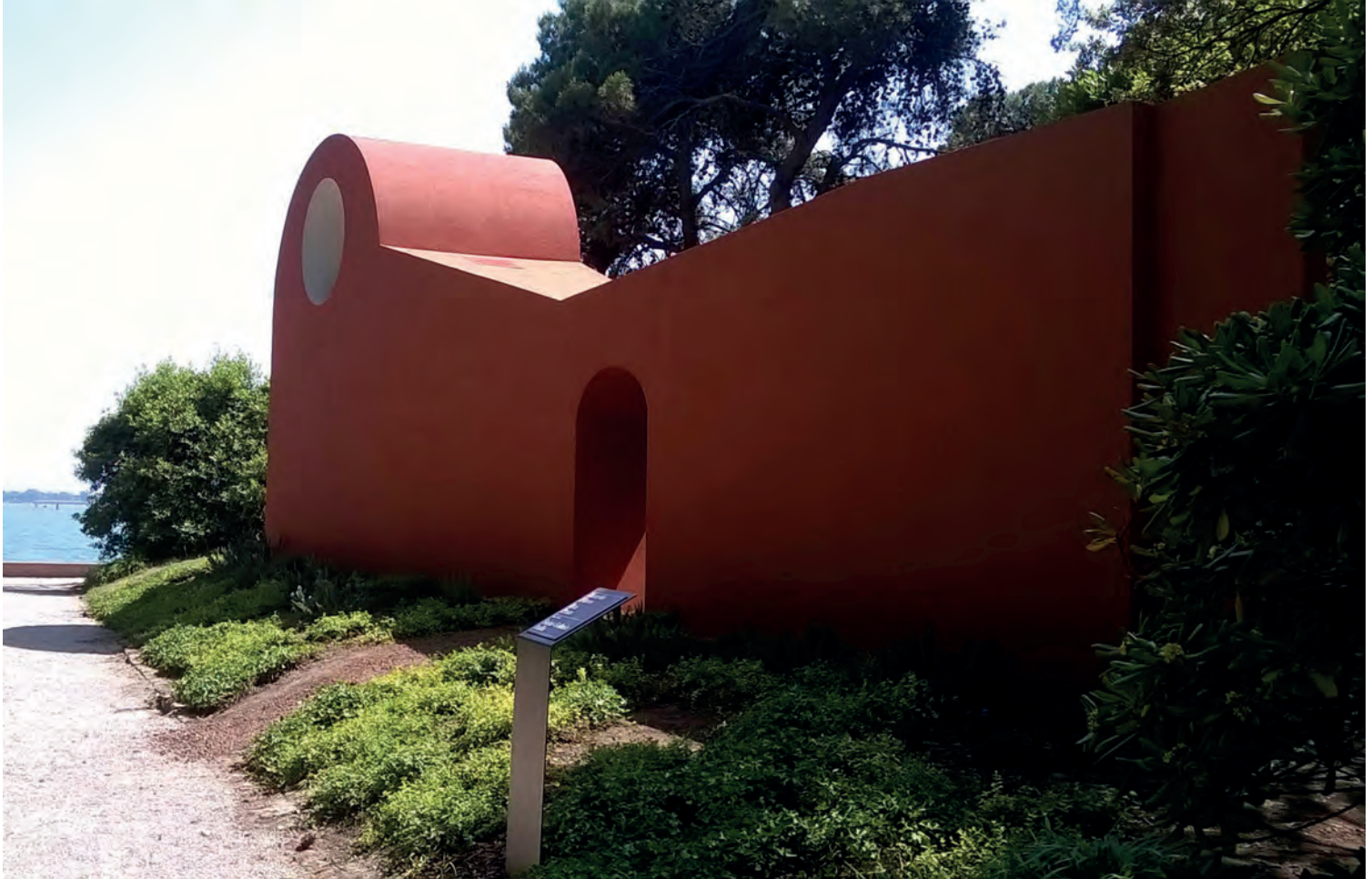
[ Foto 21. La capilla de Flores & Prats está compuesta por un muro, revestido en terrazo, con una pequeña abertura como puerta de entrada. ]