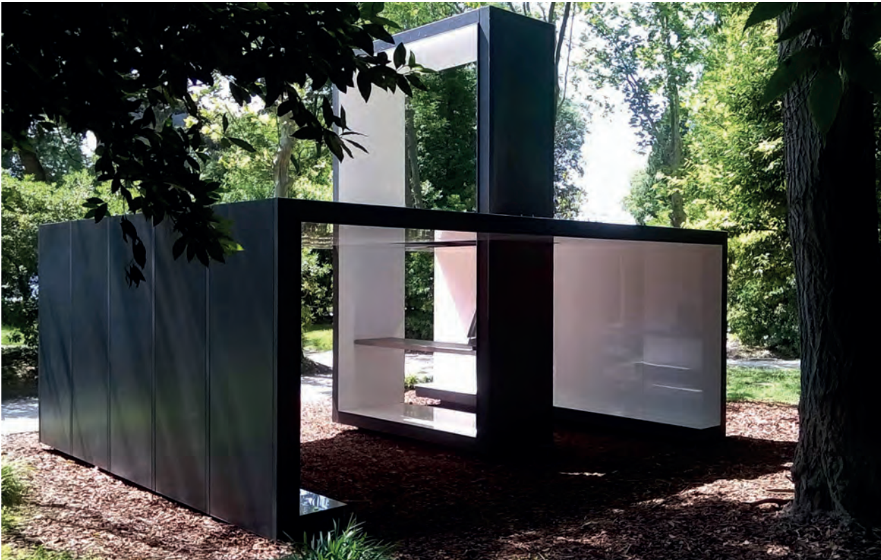
[ Foto 18. Al interior, la capilla de Cellini está pintada de blanco brillante y en el centro acoge una pequeña tabla con un atril. ]