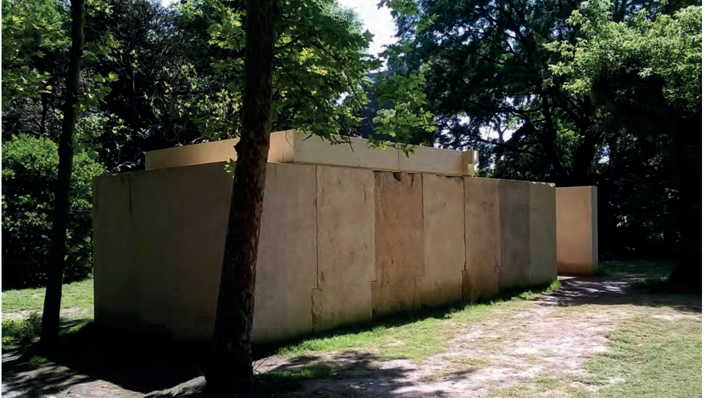
[ Foto 15. La capilla de Eduardo Souto de Moura es un recinto cerrado por bloques modulares de piedra de Vicenza, cubierto parcialmente por dos losas monolíticas. ]