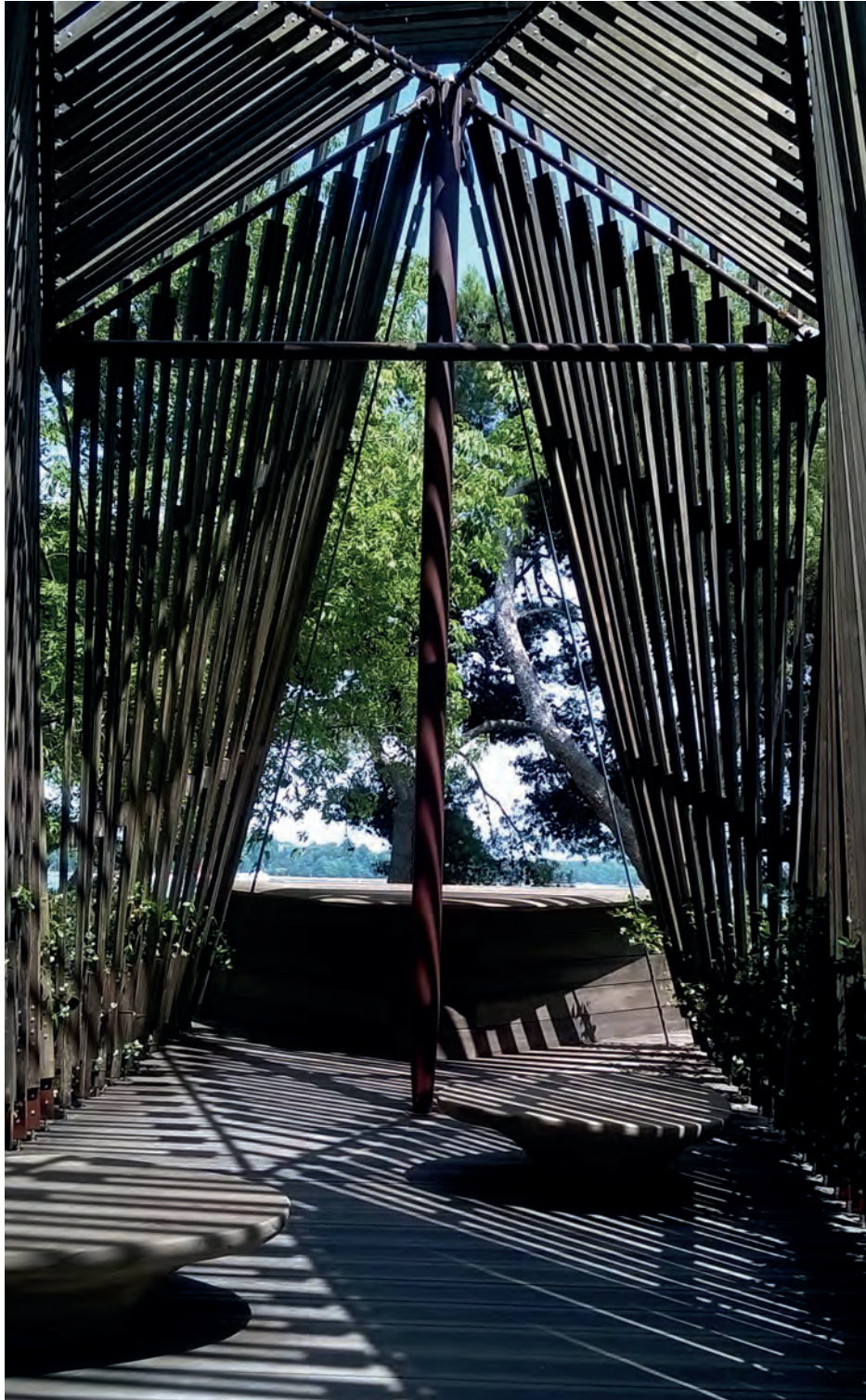
[ Foto 8. El altar de la capilla de Norman Foster con el paisaje como telón de fondo. ]