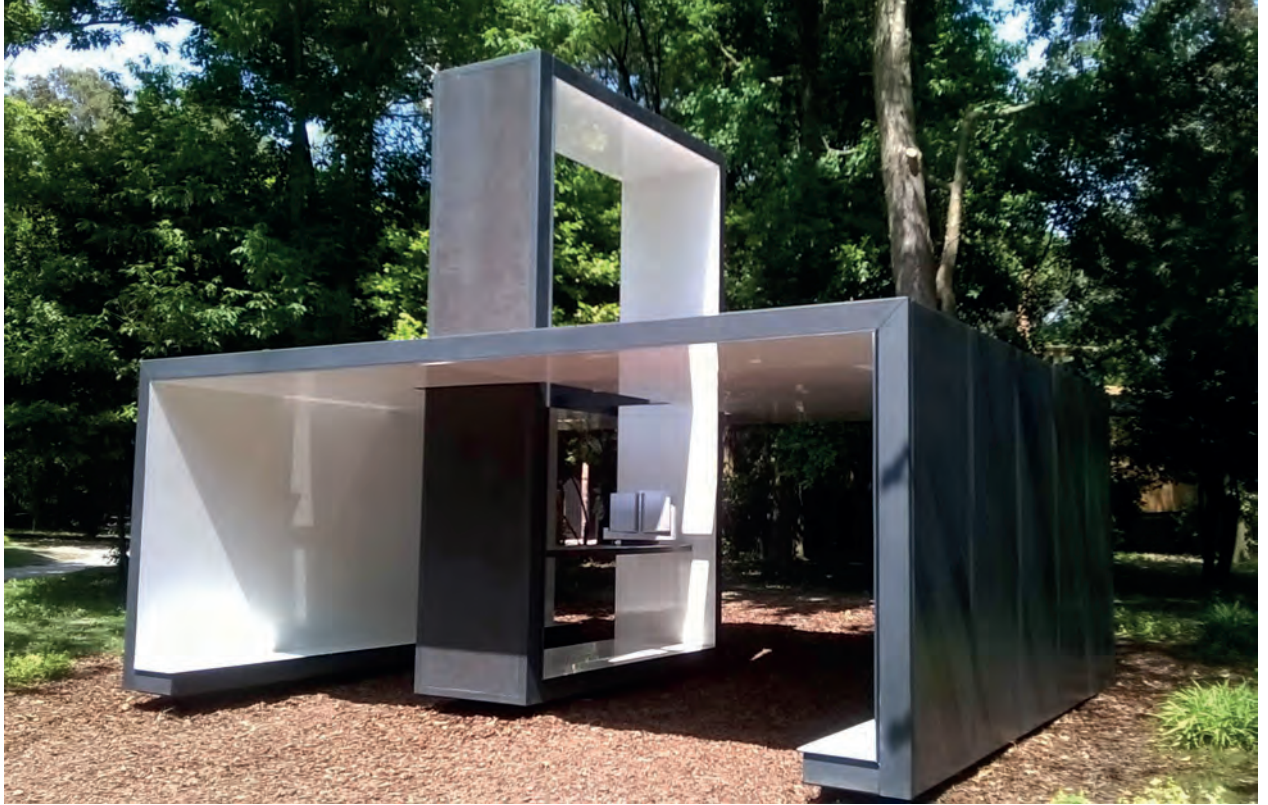
[ Foto 17. La capilla de Francesco Cellini es una estructura metálica, compuesta por dos rectángulos pintados de gris, que se apoya en suelo solo en algunos puntos. ]