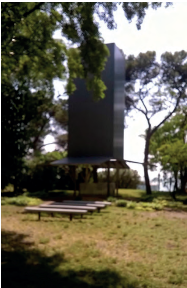
[ Foto 13. La capilla de Sean Godsell es un paralelepípedo alto de acero, que se eleva del suelo. ]