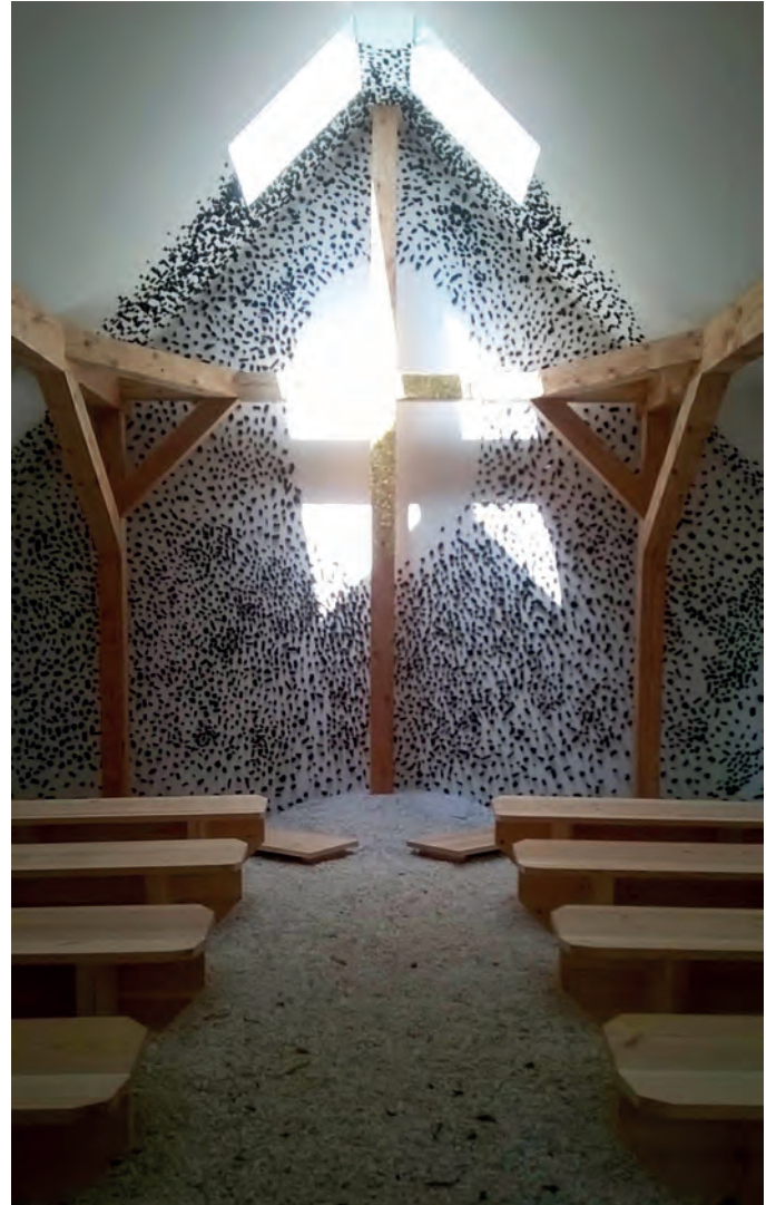
[ Foto 10. Al interior de la capilla de Terunobu Fujimori, la cruz de madera es un elemento estructural que aparece del encuentro de la viga con una columna de pequeñas hojas de oro y tres clavos. La blanca pared posterior está salpicada de trozos de carbón que crean un espacio luminoso. ]