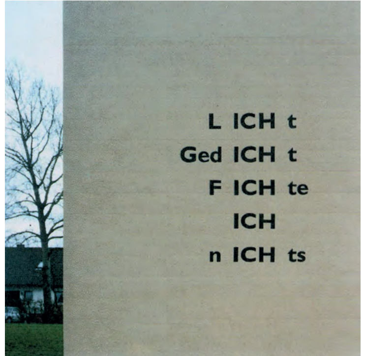
[ Ilse Garnier / France ]