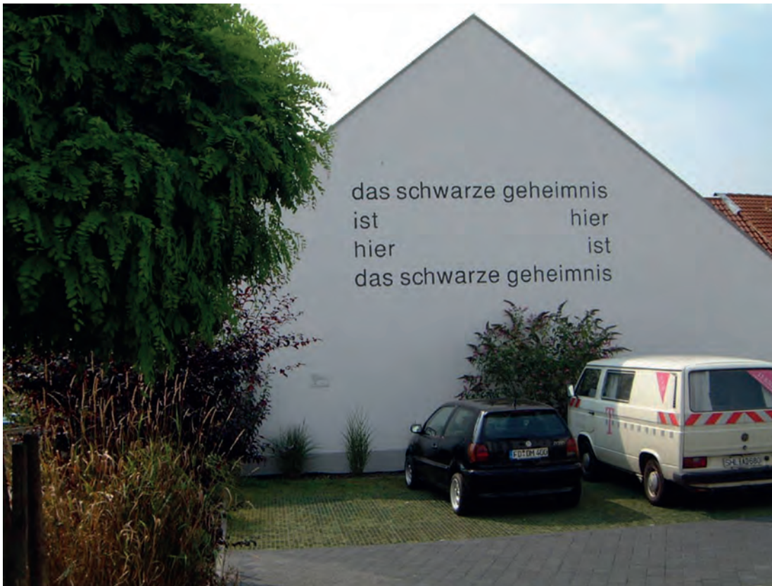
[ Eugen Gomringer / Germany ]