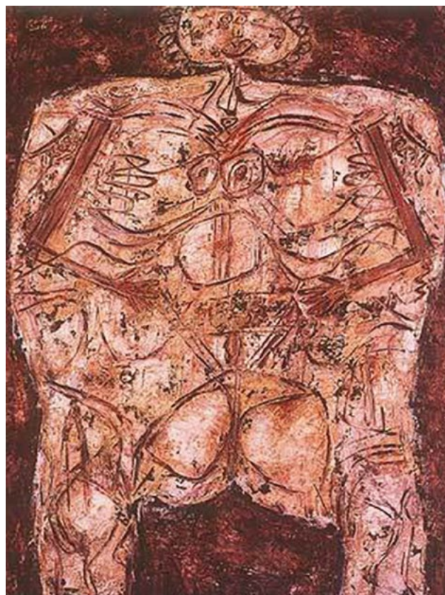
[ Figura 1. Corps de Dame Bloody Landscape , Jean Dubuffet (1950). ]