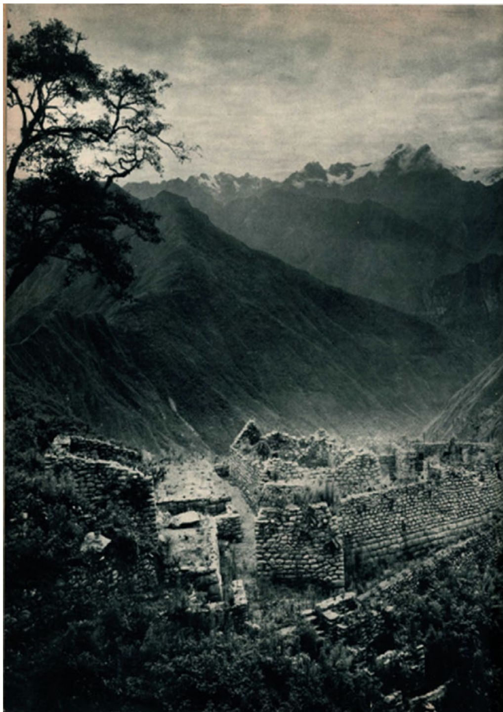
[ Figura 5. Fotografía de Machu Picchu, Número 25 de la exposición Parallel of life and art. ]