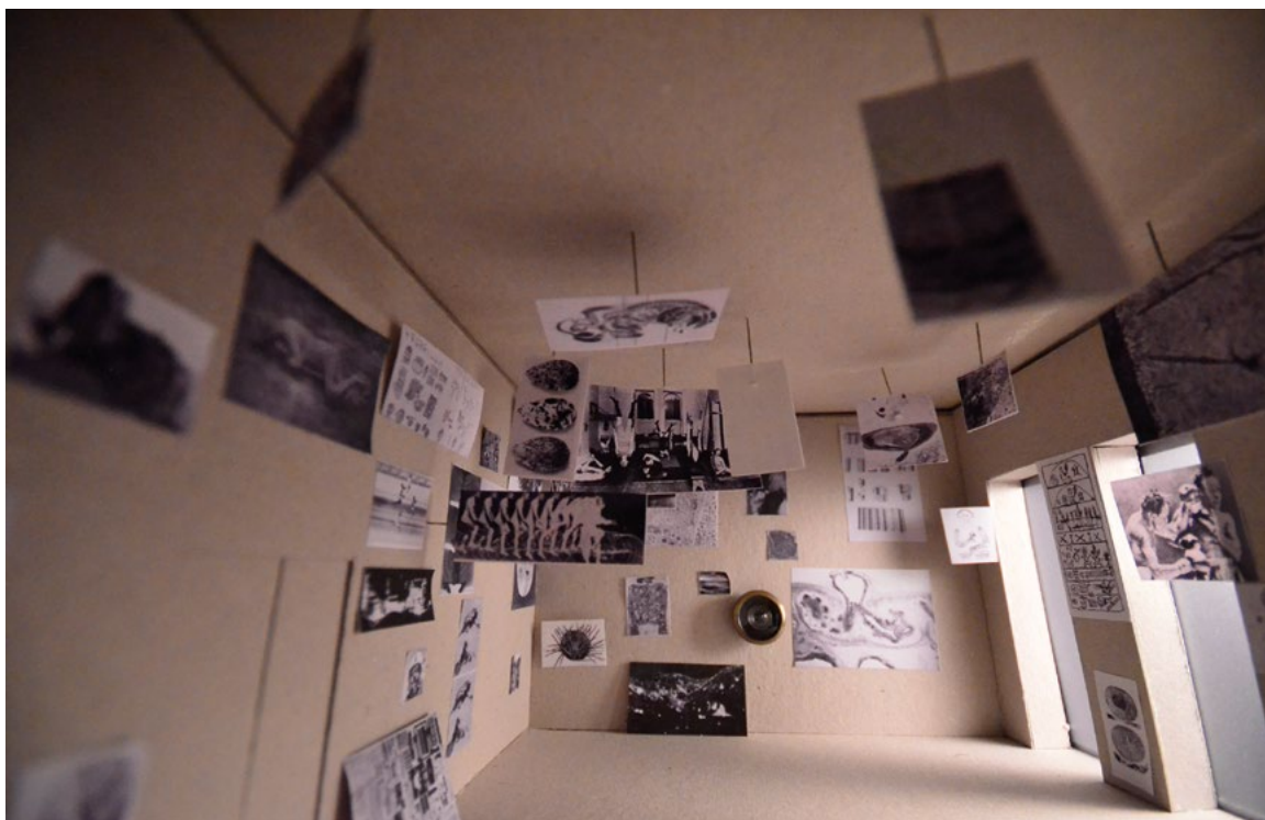
[ Figura 3. Parallel of life and art . Reconstrucción a escala por el autor, 2016. ]