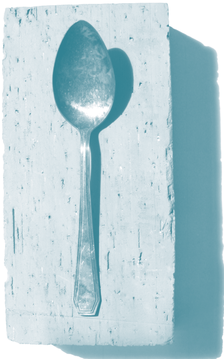
| "La cuchara y el ladrillo" Obra de Gabriel Rico |