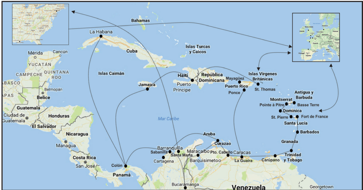
Figura 2. Detalle de la circulación de vapores europeos entre las Antillas y los puertos del Caribe (1880-1910)