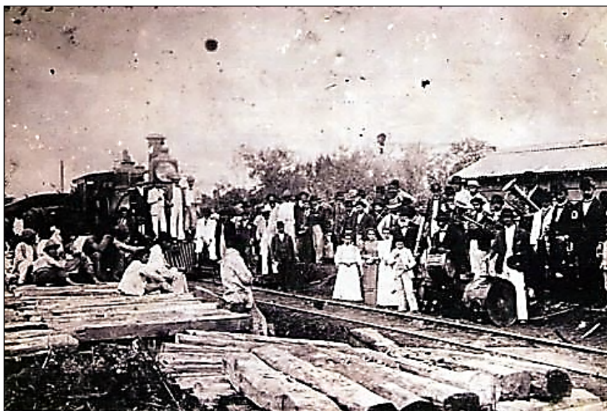
Figura 1. Inauguração da estação da estrada de ferro Muzambinho em Varginha (1892)