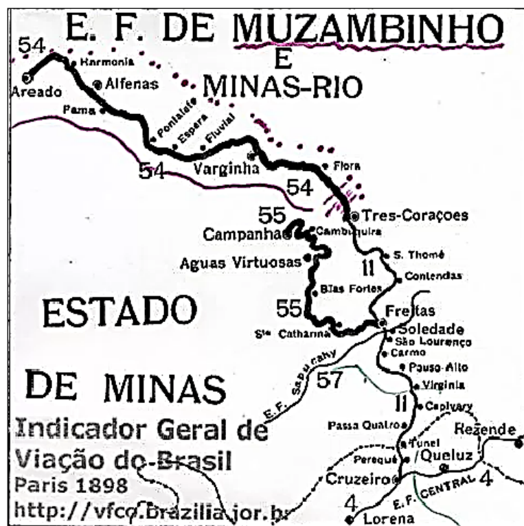
Mapa 4. O caminho percorrido pela Estrada de Ferro Muzambinho no Sul de Minas Gerais

Fonte: http://www.blogdomadeira.com.br/2012/05/120-anos-da-ferrovia-em-varginha/ Acesso em: 10/03/2018