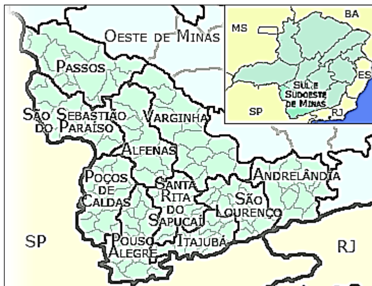
Mapa 1. A localização de Varginha no Sul de Minas Gerais e a localização da região sul-mineira no Estado