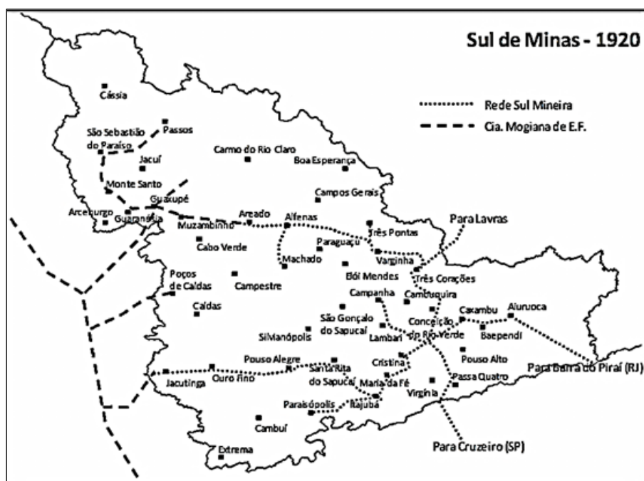
Mapa 3. Localização das ferrovias no Sul de Minas Gerais, 1920

Com o passar do tempo, a configuração das estradas de ferro que percorriam o Sul de Minas Gerais se alterou, em comparação àquela vista em 1890, por meio do mapa 2 apresentado acima neste texto. Assim, o mapa 3 abaixo mostra a localização das ferrovias no Sul de Minas em 1920.