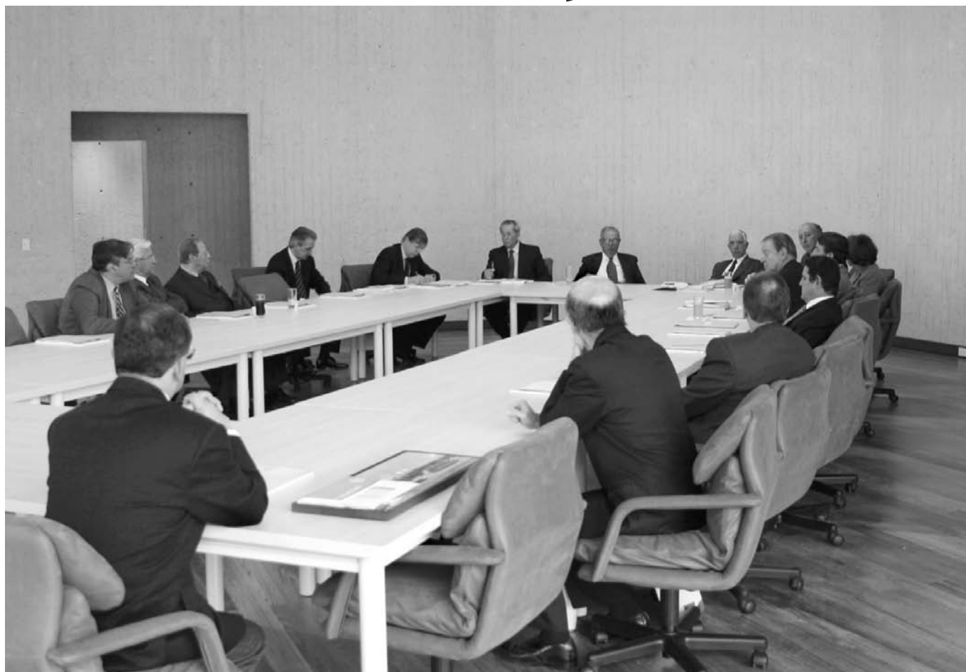
Sesión del Consejo Directivo, primera que se realiza en la sala de juntas de la nueva Biblioteca-Auditorio de la Universidad, en noviembre de 2003.