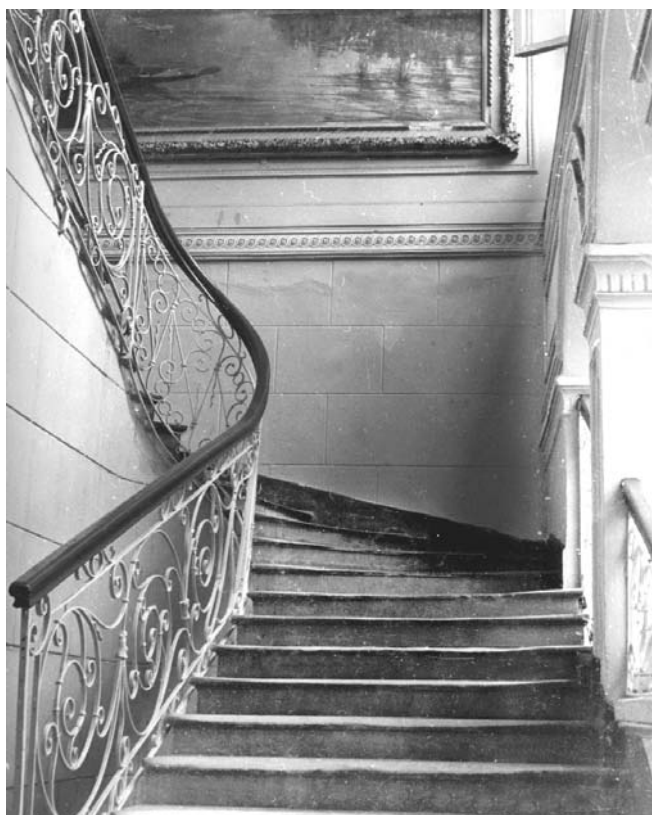
Escalera principal de Casa Vieja.

De ahí que la Universidad Jorge Tadeo Lozano, al grabar en su frontón la máxima de la sabiduría antigua "Conócete a ti mismo", propende por que nuestras viejas instituciones de cultura abandonen de esta manera el vicio que ha nacido en la infancia de nuestra propia savia, como en el resto de nuestra América hispana. Es necesario que haya un impulso renovador para que sacuda los viejos cimientos especulativos transformándolos en centros de incesante labor experimental de todas las cualidades de la materia, de todas las fuerzas del mundo físico y social, y en un foco de luz y de calor donde germinen y tomen formas prolíficas los sentimientos de solidaridad humana en que se funden las sorprendentes revoluciones del espíritu universal. Sólo así pueden los pueblos ser verdaderos creadores de cultura. La investigación científica es lo que constituye el alma de toda universidad que cumpla honradamente su misión. Formar, desarrollar y estimular el espíritu científico en el ritmo de las generaciones, es ofrecer a la nacionalidad bases inmutables de supervivencia y fortaleza, porque esto impone la verdad como rasgo de carácter colectivo, enseña a tener confianza en sí mismo,