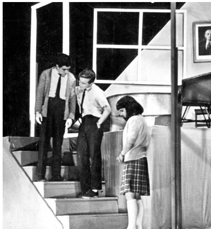
En esta página: Grupo de teatro en los años 60.

La música eleva el espíritu, crea los más nobles sentimientos. A través de la historia de la música se forma una alta cultura. En este círculo puede aprenderse y practicarse solfeo, armonía musical, teoría musical, instrumentación, etc.