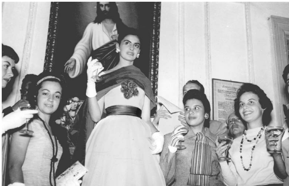
En página anterior: Delegación portando la bandera de la Universidad en la presentación de la novena de béisbol durante los Juegos Interuniversitarios de 1958. Equipos de fútbol y ping-pong.