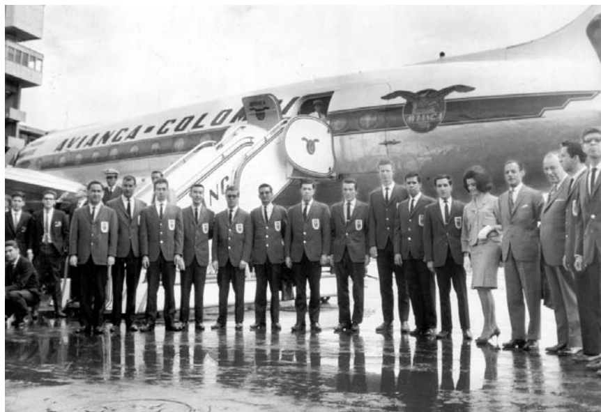
Delegación de la UJTL antes de abordar la aeronave de Avianca que los llevaría a Lima a los Juegos Deportivos Universitarios de los países bolivarianos.