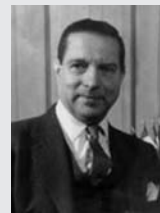
José A. Mora (1897/1981)

Secretario general de la Organización de Estados Americanos, de 1956 a 1968. Diplomático uruguayo, asistió a la Conferencia Comercial de Buenos Aires como Secretario general de la delegación del Uruguay y a la Conferencia Interamericana de Consolidación de la Paz, celebrada también en Buenos Aires. Representante temporal en la Liga de las Naciones, con sede en Ginebra. Consejero de la delegación uruguaya en tres conferencias de ministros de Relaciones Exteriores: la de Panamá, la de La Habana y la de Río de Janeiro.