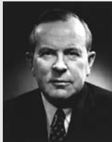
Lester Bowles Pearson (1897/1972)

Diplomático canadiense y premio Nobel de la Paz en 1957. Como Secretario de Estado consiguió llevar adelante la propuesta de una alianza occidental que culminó con la creación de la Organización del Tratado del Atlántico Norte (Otan). Condujo al establecimiento de una fuerza pacificadora de la ONU en el Canal del Suez y fue elegido para encabezar una comisión, patrocinada por el Banco Internacional para la Reconstrucción y el Desarrollo, con el encargo de revisar y establecer el futuro de la ayuda económica destinada al desarrollo de los países más atrasados.