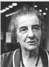
Golda Meir (1898/1978)

Líder sionista laborista, diplomática y primer Ministro de Israel. Intentó lograr un acuerdo con el rey Abdullah de Jordania, en vísperas de la invasión árabe en Israel. Implementó políticas de bienestar social, proporcionó vivienda subsidiada a los inmigrantes y orquestó su integración a la fuerza laboral del país. Inició la política israelí de cooperación con las recién independizadas naciones africanas y se esforzó por cimentar las relaciones con Estados Unidos. Estableció relaciones bilaterales con los países de América Latina y logró un acuerdo de cese al fuego con Egipto.