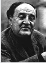
Raúl Haya de la Torre (1895/1979)

Político peruano, máximo exponente del antimperialismo yanqui y de la unidad indoamericana. Líder estudiantil enfrentado a la dictadura del presidente Augusto Bernardino Leguía, que lo obligó a exiliarse en Panamá, Cuba y México. Es autor de Por la Emancipación de la América Latina. Teoría y Táctica del Aprismo, ¿A dónde va Indoamérica? , entre otras, que recogen su sentimiento de unidad iberoamericana contra la influencia de Estados Unidos.