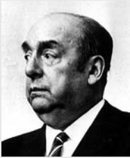
Pablo Neruda (1904/1973)

Poeta chileno, galardonado con el Premio Nobel de Literatura. Su verdadero nombre era Ricardo Neftalí Reyes Basoalto. Llamado a veces "el poeta de la humanidad esclavizada", escribió poemas en los que reclama reformas sociales. Activo político, de ideas izquierdistas, fue miembro del Partido Comunista chileno y senador. En reconocimiento a su valor literario fue incorporado al cuerpo consular chileno y representó a su nación en diversos países de Asia y Latinoamérica, en España y en Francia. Designado candidato a la presidencia de Chile por su partido, renunció en favor de su amigo Salvador Allende.