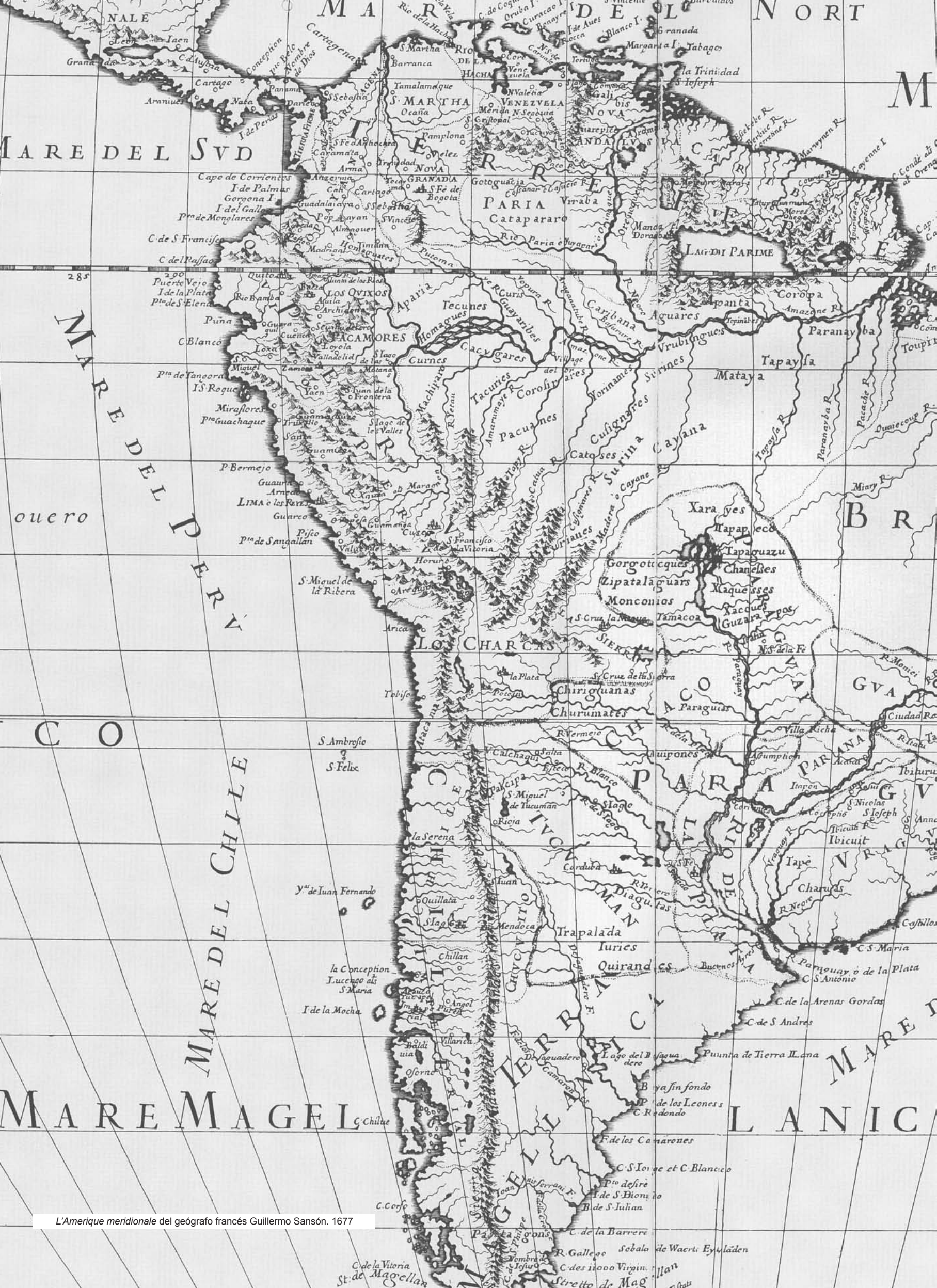
L'Amérique meridionale del géographe français Guillermo Sansón. 1677