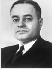
Ralph Johnson Bunche (1904/1971)

Diplomático estadounidense y galardonado con el premio Nobel de la Paz. Participó en la redacción de la Carta de las Naciones Unidas, y como miembro principal del personal de la comisión de la ONU en Palestina participó en los esfuerzos de mediación que dieron como resultado el reconocimiento del Estado de Israel. Obtuvo el aprecio internacional por su habilidad como mediador, después de negociar los cuatro acuerdos de armisticio que finalizaron con la guerra árabe-israelí de 1948-1949. Responsable del programa sobre usos pacíficos de la energía atómica.