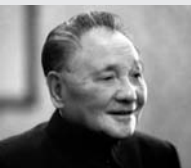
Deng Xiaoping (1904/1997)

Jefe militar y de gobierno chino, inspirador de la política "Un país, dos sistemas" y considerado hoy como "figura inmortal" y "arquitecto general de la política de reforma y apertura al exterior de China". Se unió al Fondo Monetario Internacional y al Banco Mundial, estableciendo zonas especiales de empresa y otras iniciativas para atraer la inversión extranjera. En política exterior, desarrolló estrechas relaciones con Japón y Estados Unidos.