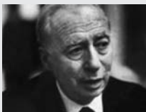
Hans J. Morgenthau (1904/1979)

Teórico estadounidense, nacido y educado en Alemania. Es considerado el padre del realismo moderno en las relaciones internacionales. Su obra cumbre, Política de Poder entre las Naciones: La Lucha por el Poder y por la Paz resume lo que podría ser el ideal de la diplomacia moderna. Fue profesor distinguido de ciencias políticas de la Universidad de Nueva York, profesor invitado de las universidades de Yale, Columbia y California, y asesor de los departamentos de Estado y Defensa del gobierno de Estados Unidos.