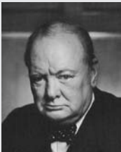
Winston Churchill (1874/1965)

Estadista y escritor inglés, su nombre completo era Winston Leonard Spencer Churchill. Primer Ministro de Gran Bretaña durante la II Guerra Mundial, animó a los británicos a enfrentarse a la Alemania nazi. Su visión del mundo lo convierte en ficha clave de los aliados para ganar la guerra, en la que luchó por conseguir ayuda militar y apoyo moral de Estados Unidos. Fue el artífice de la 'Gran Alianza' cuando, en 1941, soviéticos y estadounidenses entraron a la guerra. Fue ganador del Premio Nobel de Literatura.