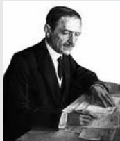
Leo S. Rowe (1871/1946)

Diplomático estadounidense. Director general de la Unión Panamericana, de 1920 a 1946, organismo precursor de la Organización de Estados Americanos. Integró la comisión que revisó y compiló las leyes de Puerto Rico. Fue Presidente de la American Academy of Political Science , delegado de los Estados Unidos de Norte América a la III Conferencia Panamericana, delegado al I Congreso Científico Panamericano, Secretario general de la Conferencia Financiera Panamericana, y encargado de los asuntos latinoamericanos en el Departamento de Estado de los Estados Unidos.