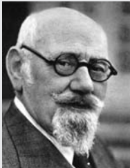
Karl Renner (1870/1950)

Político y economista austriaco. Nombrado Canciller, gobernó con una coalición de socialdemócratas y socialcristianos. Después de la II Guerra Mundial fue el primer Canciller de la Austria liberada y, al final de su mandato, el Parlamento lo eligió por unanimidad Presidente de la República. Firmó el tratado de Saint Germain y escribió la Teoría de la Economía Capitalista: el Marxismo y el Problema de la Socialización .