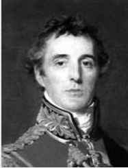
Duque de Wellington (1769/1852)

Militar y político británico. Logró devolverle a Europa los pueblos invadidos por Napoleón y favoreció la restauración monárquica en Francia y España. Sus intervenciones militares se sucedieron en Bélgica, la India y Dinamarca. Experimentó sus más gratas victorias en Portugal y en España. Con la batalla de Waterloo obtuvo un merecido reconocimiento.