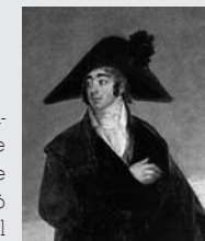
Carlos Francisco Fernán Núñez (1779/1822)

Político portugués, nacido Carlos Gutiérrez de los Ríos, séptimo conde de Fernán Núñez. Formó parte de la camarilla del príncipe de Asturias, tomó parte en las cortes de Bayona y se desempeñó como embajador en Londres. Firmó los tratados de París y Viena e intervino en las negociaciones a escala europea que provocaron la invasión de los Cien mil hijos de San Luis.