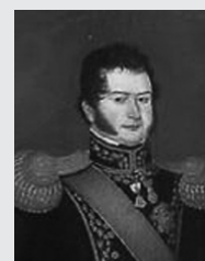
Bernardo O'Higgins (1778/1842)

Militar chileno, prócer de la independencia americana y libertador de Chile. Primer Jefe de Gobierno americano en mirar hacia el mar. Obtuvo el título de Capitán General y es reconocido en Chile como un héroe nacional. Durante su mandato tuvo que enfrentarse a la bancarrota de 1818, pero fomentó la educación nacional y las obras públicas. Murió cuando se disponía a regresar a su patria, luego del exilio en Lima.