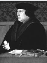
Oliver Cromwell (1599/1658)

Lord protector de Inglaterra, Escocia e Irlanda. Apoyó al partido puritano contra la arbitrariedad monárquica y contra el episcopado, a tal punto que el rey fue condenado a muerte. Proclamó la República o Commonwealth, arrebató Jamaica a España en 1655, elevó el poder militar y naval inglés a un nivel nunca alcanzado hasta entonces y firmó numerosos tratados comerciales.