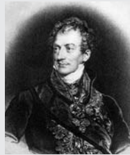
Príncipe Klemens de Metternich (1773/1859)

Político y diplomático austriaco. Desempeñó misiones diplomáticas en Gran Bretaña, Sajonia, Prusia y Francia, en las que demostró una gran astucia y habilidad. Principal figura política de su país durante la primera mitad del siglo XIX, artífice del equilibrio de poder europeo que mantuviera la paz continental. Organizó una alianza internacional para combatir las ideas nacionalistas y liberales que amenazaban al restaurado orden europeo. Se negó a la reconstrucción del Sacro Imperio Romano Germánico, sustituyéndolo en Europa Central por una débil Confederación Germánica controlada por Austria.