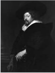
Peter Paul Rubens (1577/1640)

Uno de los grandes genios del Barroco y una de las principales figuras de la pintura. Reunía singulares dotes artísticas, conocimientos humanísticos, dominio de varias lenguas modernas y una especial habilidad para la diplomacia, convirtiéndose en ejemplo para la intelectualidad de la época. Al servicio de la corte de Mantua, sirvió igual en asuntos culturales que diplomáticos. Nominado secretario del Consejo de Flandes, sus últimos trabajos fueron para las monarquías ibéricas.