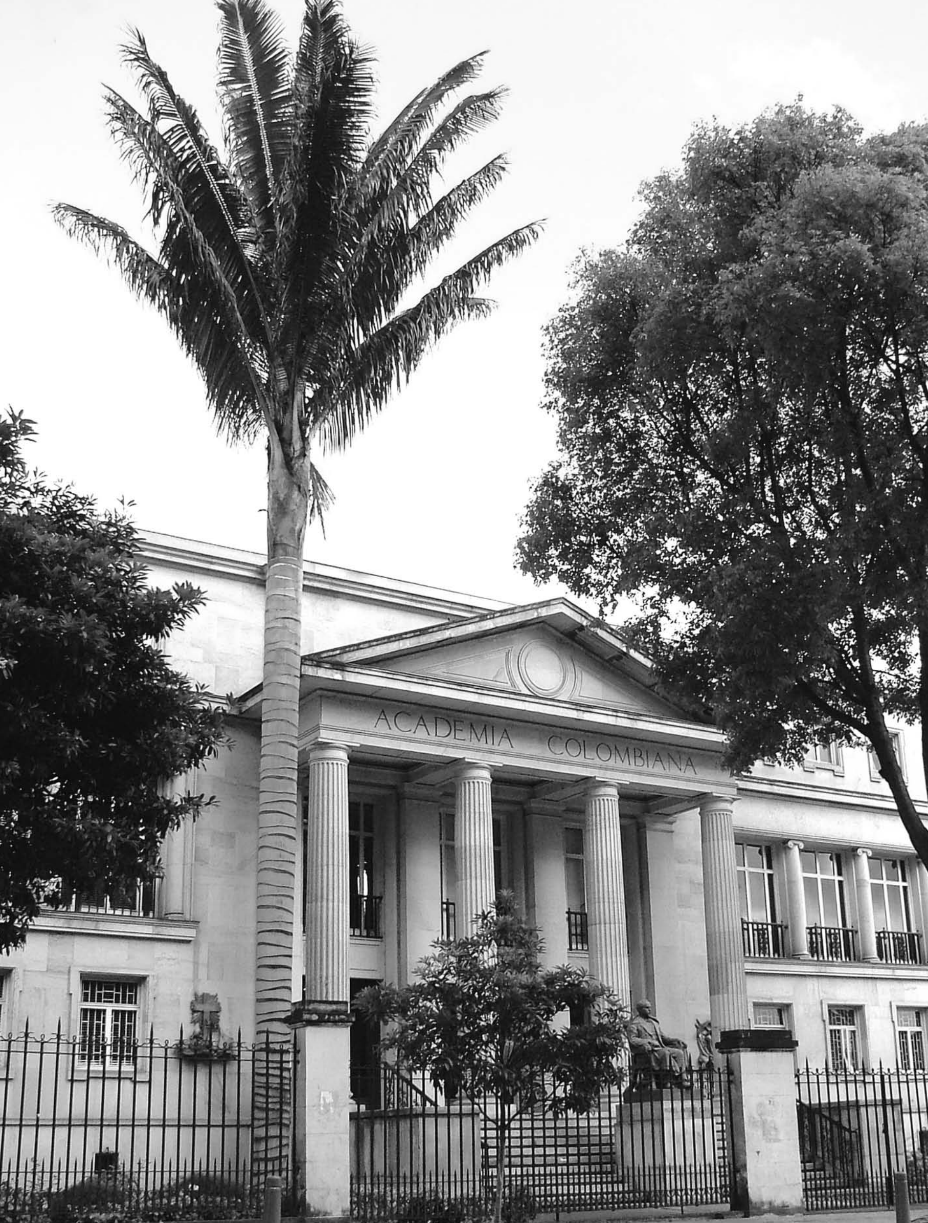
SEDE DE LA ACADEMIA COLOMBIANA DE LA LENGUA EN BOGOTÀ.