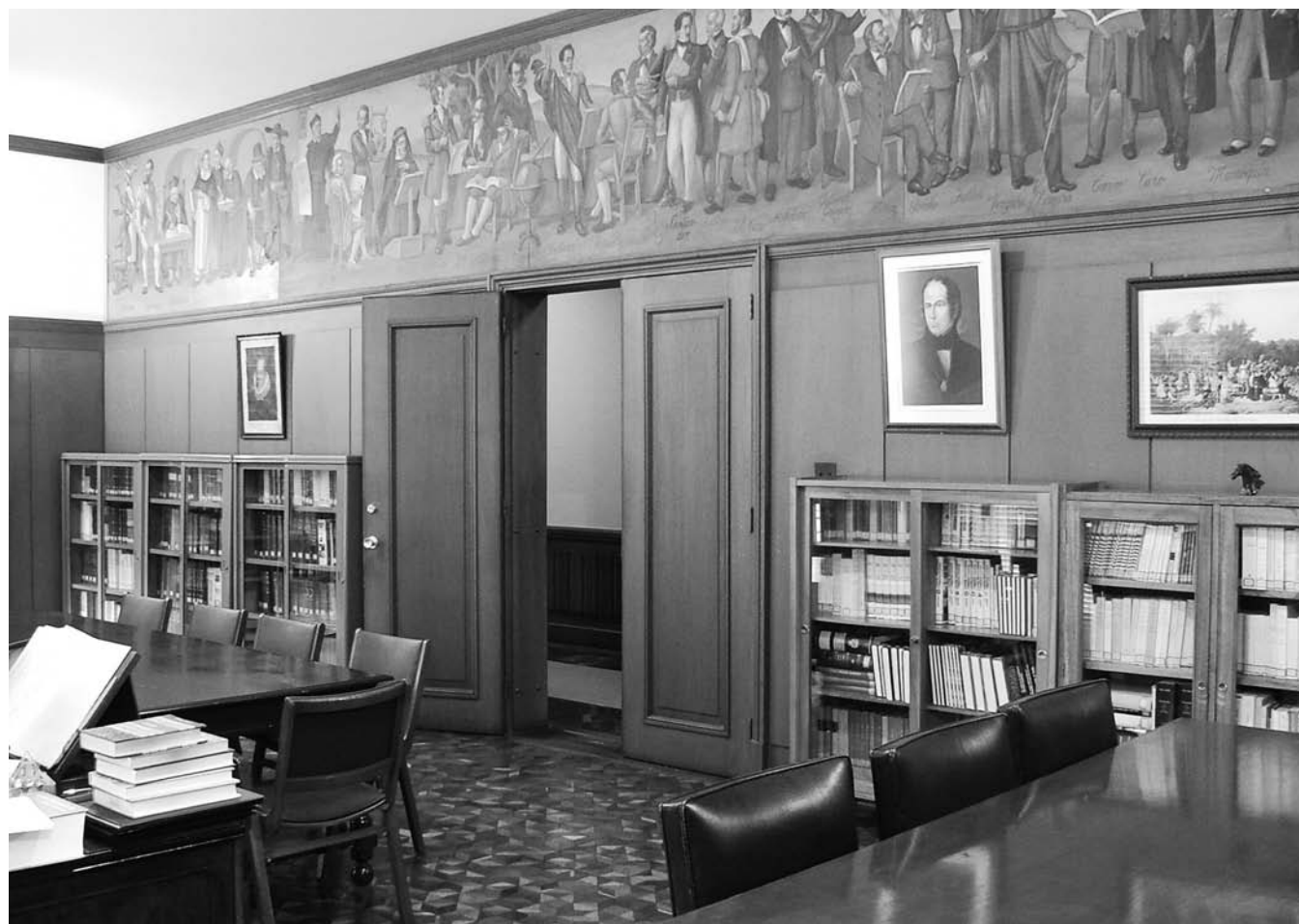
◀ SALA DE LECTURA-ACADEMIA COLOMBIANA DE LA LENGUA. BOGOTÁ.

allí son estudiadas y, en el caso de ser aprobadas, se incorporan al diccionario oficial. Este procedimiento procura la defensa y el cultivo del idioma castellano, sin dejar de lado, por supuesto, la preocupación por el futuro de su unidad en el tercer milenio.