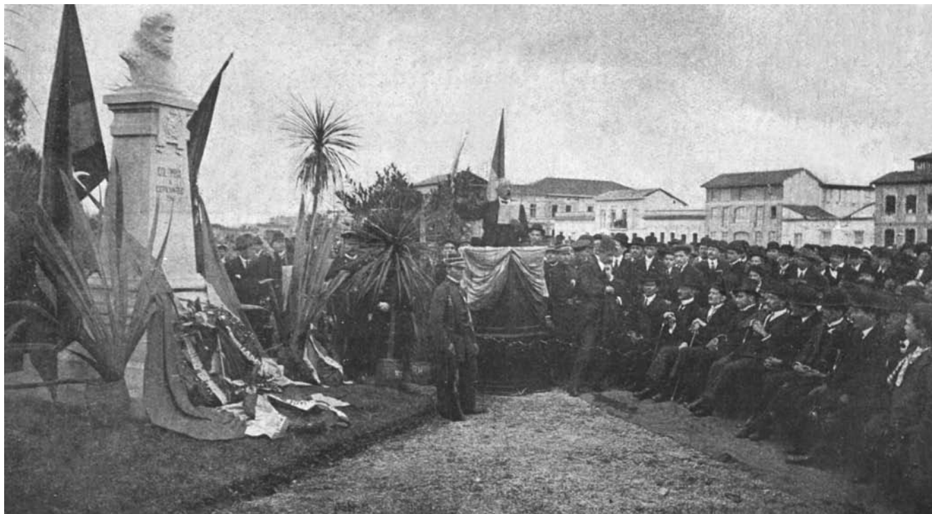
LA ACADEMIA INAUGURA BUSTO DE CERVANTES. ACTO CELEBRADO EL DOMINGO 21 DE MAYO DE 1916 EN LA PLAZA ESPAÑA DE BOGOTÁ.