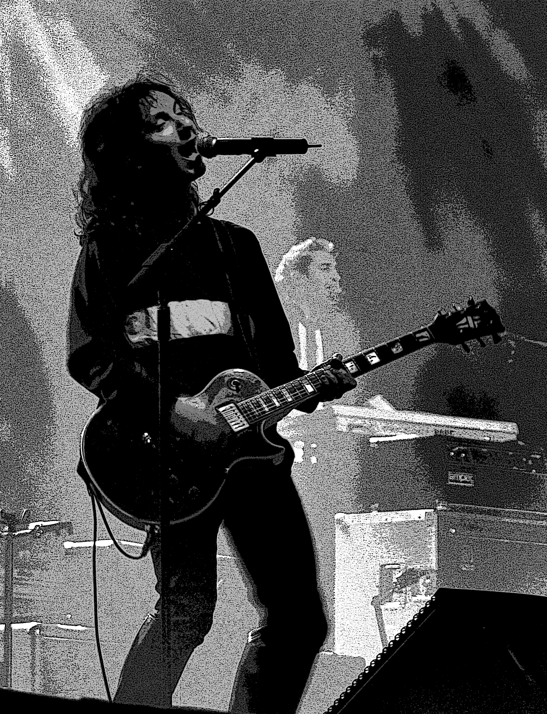
FOTOGRAFÍA: ROCK AL PARQUE 2006 TOMADA POR LUIS CARLOS CELIS CALDERÓN