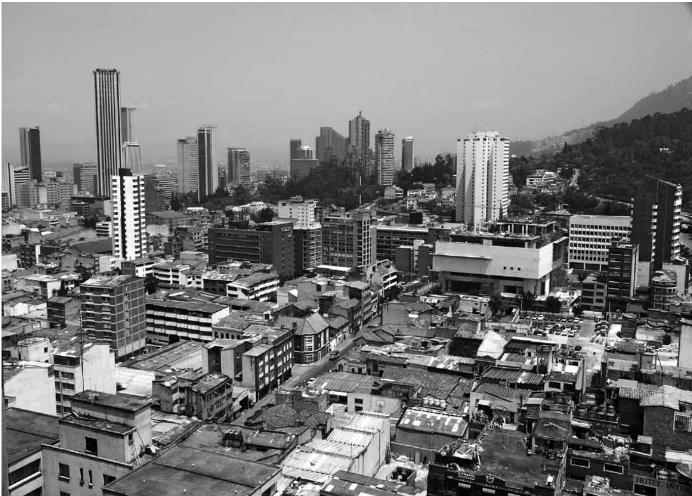
PANORÁMICA DE BOGOTÁ HACIA EL NORTE. LA BIBLIOTECA - AUDITORIO DE LA UJTL EN CONSTRUCCIÓN, 2003.

y manejo, etc., además de nuevos instrumentos de gestión como las plusvalías, la transferencia de derechos de desarrollo y la expropiación por vía administrativa, entre otros. La Corporación muy pronto entendió que para lograr sus objetivos era indispensable trabajar de la mano con la Administración Distrital y para ello estableció vínculos con la Alcaldía Mayor así como con las distintas entidades que tienen como propósito la planeación y el desarrollo urbano. Fue una oportunidad para iniciar el mejoramiento de las relaciones entre el sector académico, representado por la Corporación y la Administración Distrital, con la organización y celebración de distintos foros y la elaboración de propuestas de carácter urbano. Esta permitió crear un nuevo clima de confianza y compromiso entre las partes.