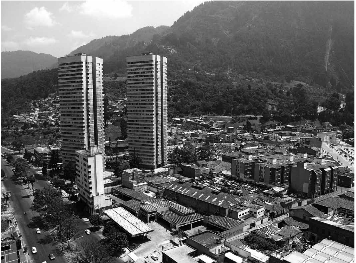
AVENIDA TERCERA, TORRES DE FENICIA, 2003.

mas detallada de las implicaciones de los ambientes urbanos en la actividad física y en la calidad de vida de los adultos mayores en la ciudad de Bogotá. Los resultados de esta segunda fase serán presentados en el primer simposio internacional sobre el tema que se lleva a cabo en Latinoamérica, en el cual se contrastarán los hallazgos realizados con investigaciones equivalentes en otros lugares del mundo. Igualmente se tocarán temas relacionados con la calidad de vida y se formularán recomendaciones a los tomadores de decisiones tanto de la ciudad de Bogotá como de otras ciudades, como una contribución al mejoramiento de la calidad de vida de sus habitantes. El simposio contará con destacados investigadores de la comunidad científica internacional y se espera la participación de conferencistas de distintos países, entre ellos Colombia, USA y Brasil. El evento se llevará a cabo los días