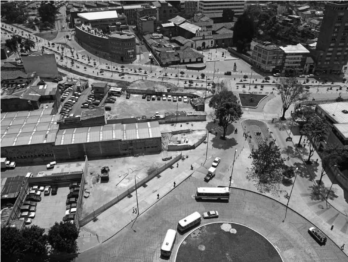
EJE AMBIENTAL A LA ALTURA DE LA CALLE 19, 2003.

Urbana, Defensoría del Espacio Público), permitió formular una propuesta integrada, al nivel del componente urbano de los Planes de Regularización y Manejo, que fue insumo importante del Plan Zonal para el centro de Bogotá.