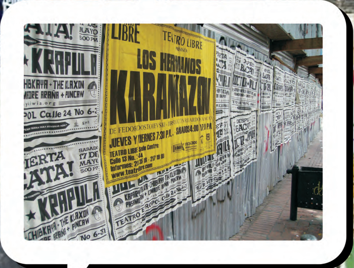
carrera 7 calle 20