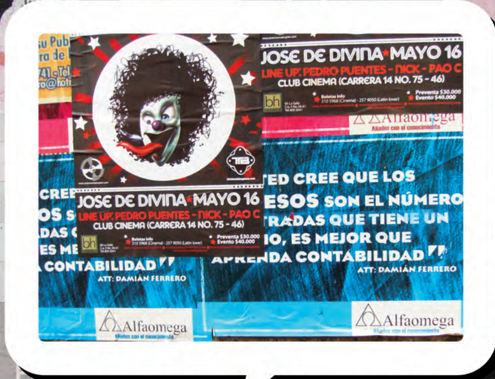
calle 14 carrera 6