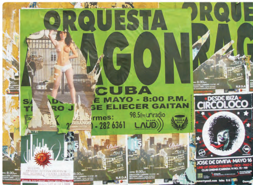
carrera 4 calle 14