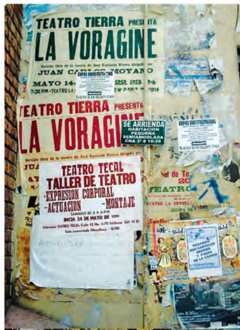
carrera 4 calle 13