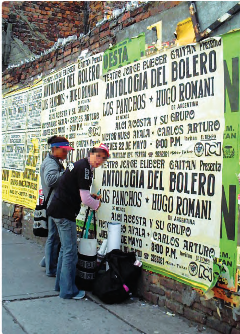
carrera 5 calle 21