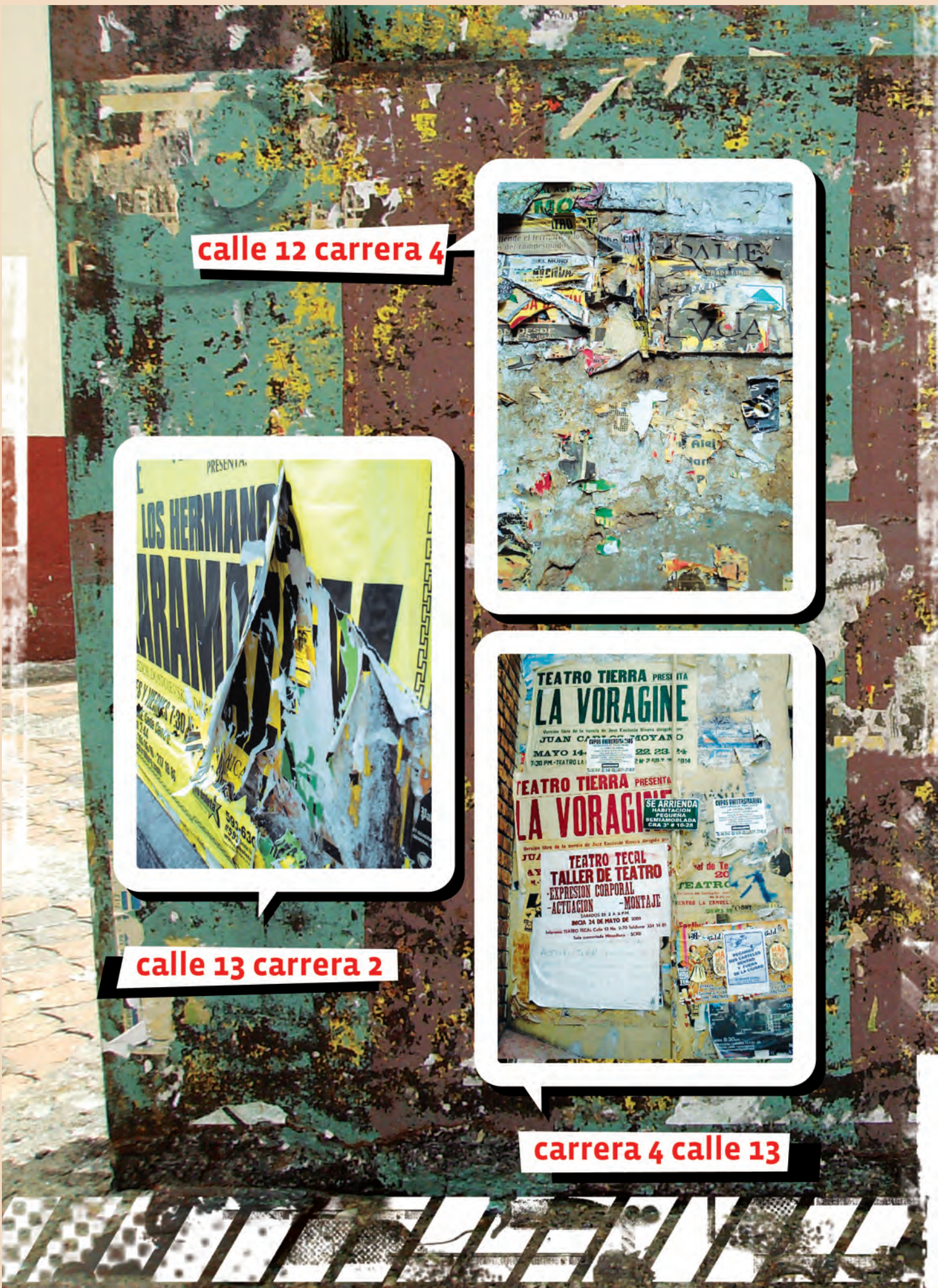
calle 12 carrera 4