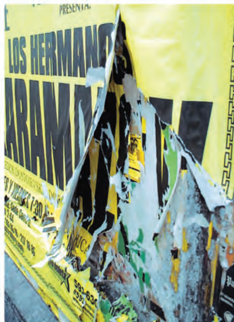
calle 13 carrera 2