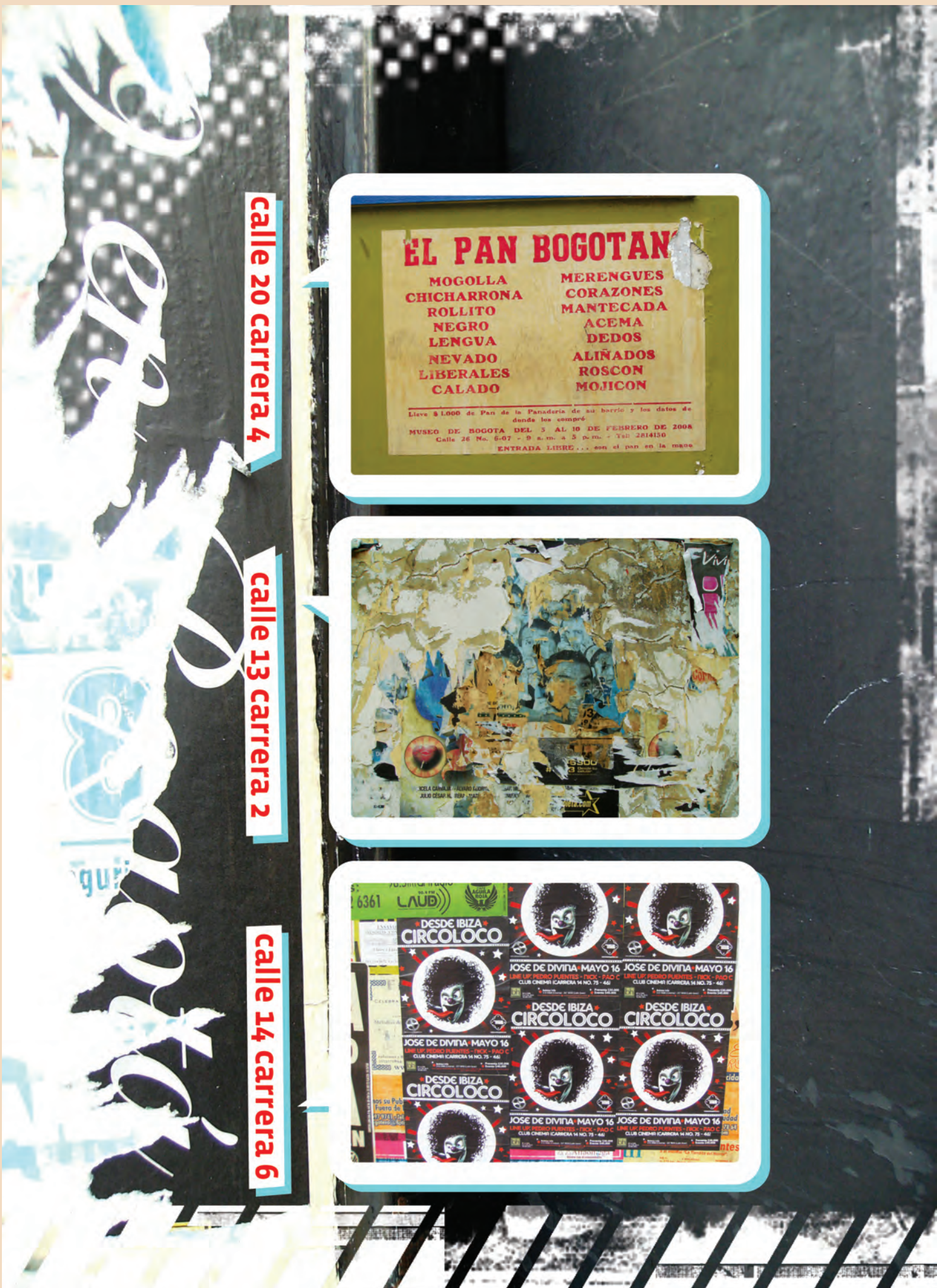
calle 20 carrera 4