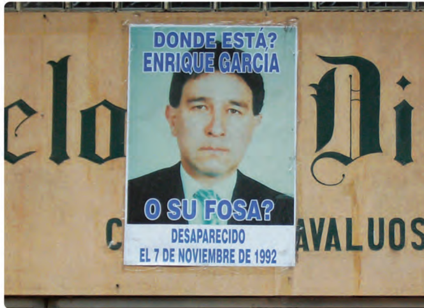
calle 12 carrera 6