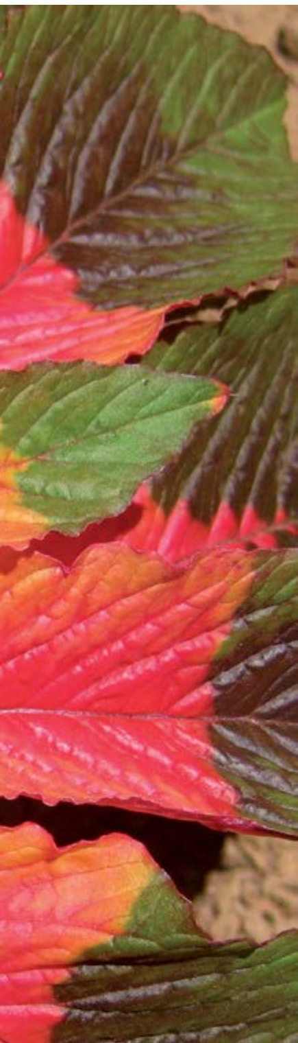
Fotografía: Ion Kulkens, Illumination (Creative Commons Attribution – Share Alike 2.0 Generic license).

llevó a cabo un ejercicio, con orientación guiada, con el objetivo de iniciar a los jóvenes en una experiencia de meditación que les permitiera experimentar un camino para conocer y explorar el estado de contemplación.