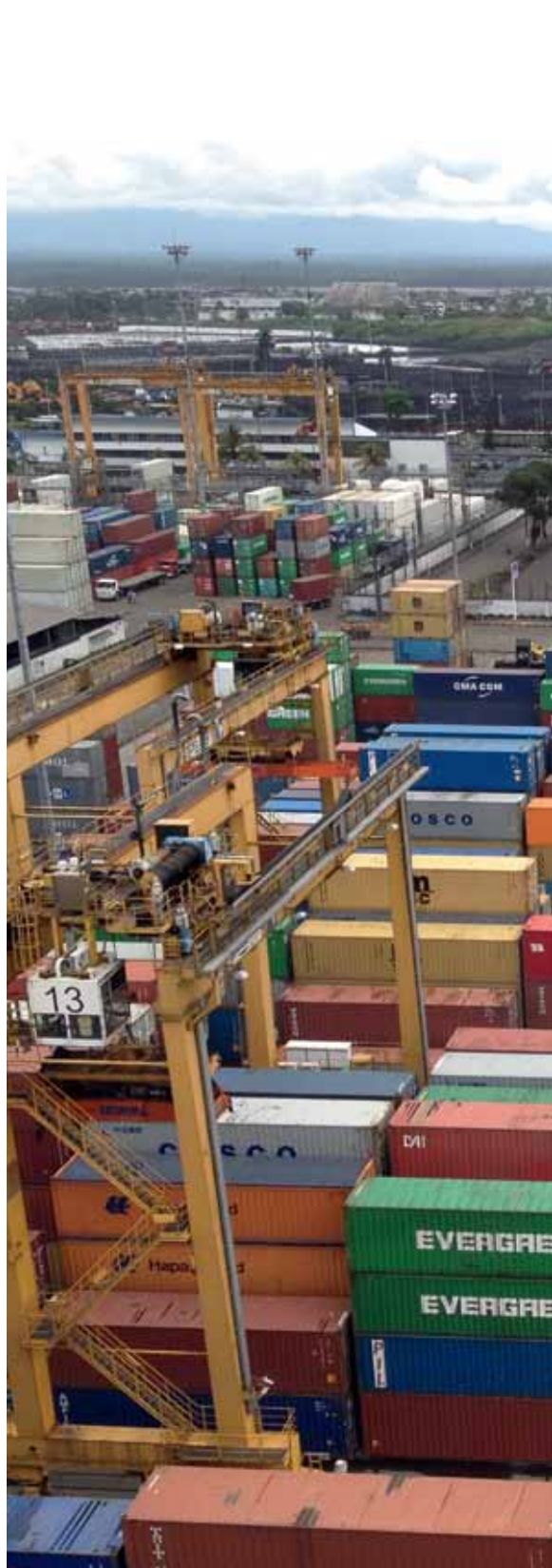
Puerto de Buenaventura

The country is celebrating twenty years of institutionalizing the Ministry of Commerce, Industry and Tourism (initially Ministry of Foreign Trade), resulting from the issuance of Law No. 7 of 1991, which established, in addition, a new regulatory framework regulating this activity. The Colombian foreign trade reforms, whose significance was popular “openness”, were aimed at clearing a series of measures that provided protection to the productive sector, reducing state intervention in resource allocation processes,