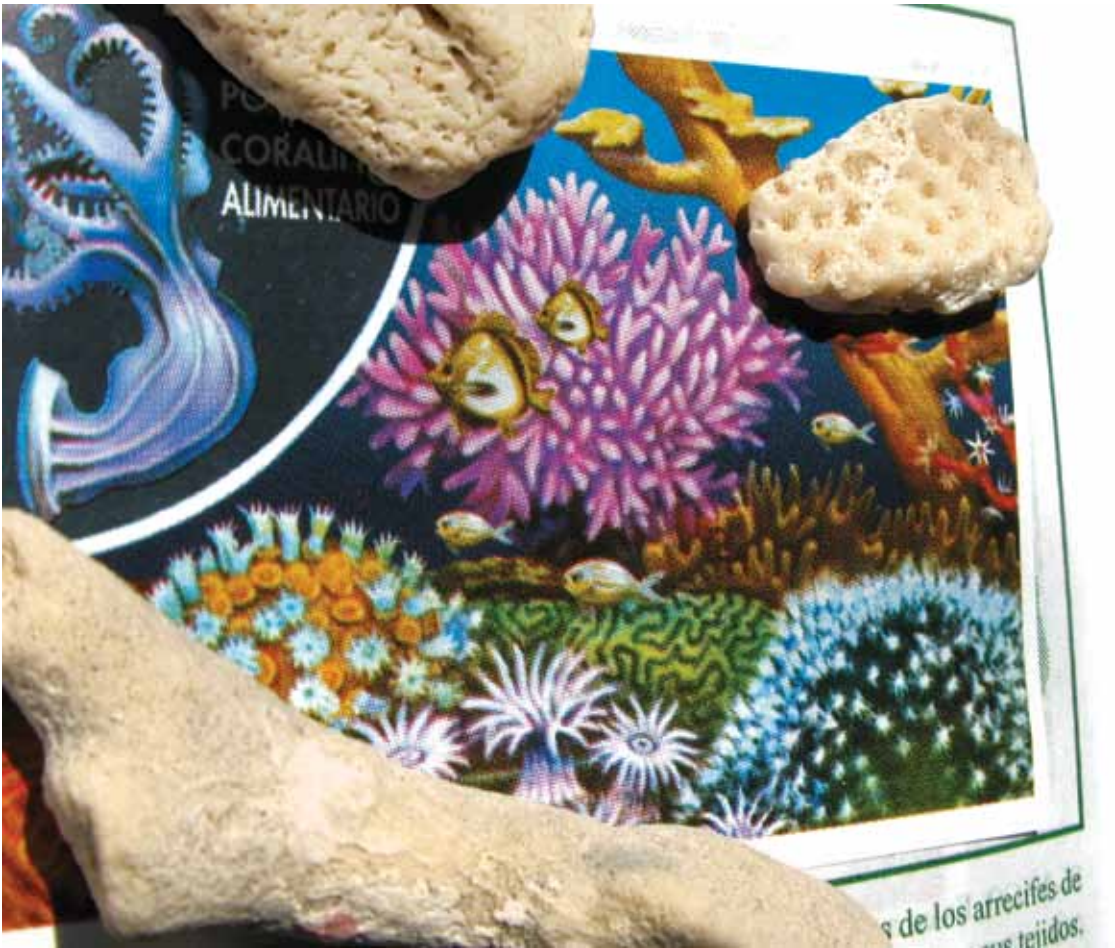
Ilustración: Enrique Lara

mación sólida del relieve del fondo marino, constituida de manera predominante por el desarrollo acumulado de corales pétreos, también llamados corales duros o madreporas.