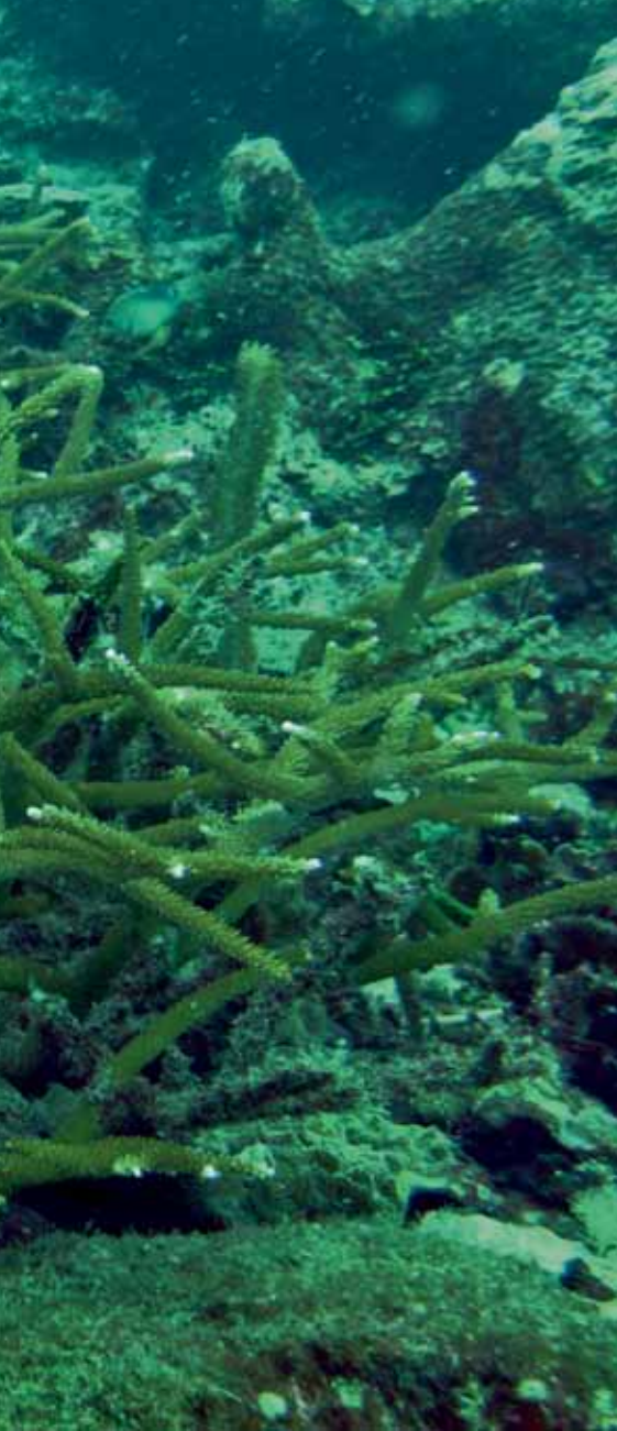
► Figura 1. Corales duros en forma de cacho de venado ( Acropora cervicornis ).

exoesqueleto de carbonato de calcio el cual le da protección y forma. Una vez el pólipo está totalmente desarrollado puede dividirse en dos y estos dos se dividirán a su vez, por lo que unos años después se tendrá una colonia. Las colonias van creciendo mediante la producción de nuevos pólipos, todos genéticamente idénticos (o clonales), y en este proceso se va acumulando carbonato de calcio, el cual es el material que compone los arrecifes coralinos. En este artículo se resumen los aspectos biológicos y ecológicos más importantes de los corales que forman los arrecifes coralinos.