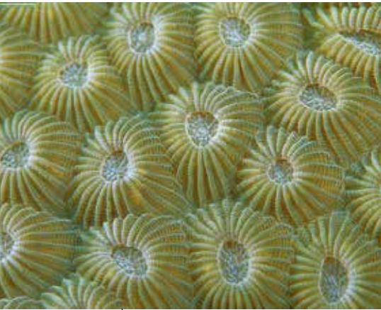
La naturaleza marina, epicentro de la historia de la Tierra.

la atmósfera a través del uso de combustibles fósiles por parte de las sociedades. Se calcula que la tercera parte de todas las emisiones antropogénicas de los últimos doscientos años han sido absorbidas por los océanos 10 . Esto modera las tasas de cambio climático, pero causa cambios en la química de los océanos: el pH del agua marina ha disminuido de manera progresiva y los océanos se han acidificado. De esta manera, el calentamiento y la acidificación de los océanos generan, por ejemplo, daños en los ecosistemas de los arrecifes coralinos, con efectos socioeconómicos significativos 11 . El calentamiento de la superficie del océano tiene un impacto importante sobre la biota marina y sobre el ciclo del carbono, que incluye la cantidad de carbono transportado a las profundidades marinas.