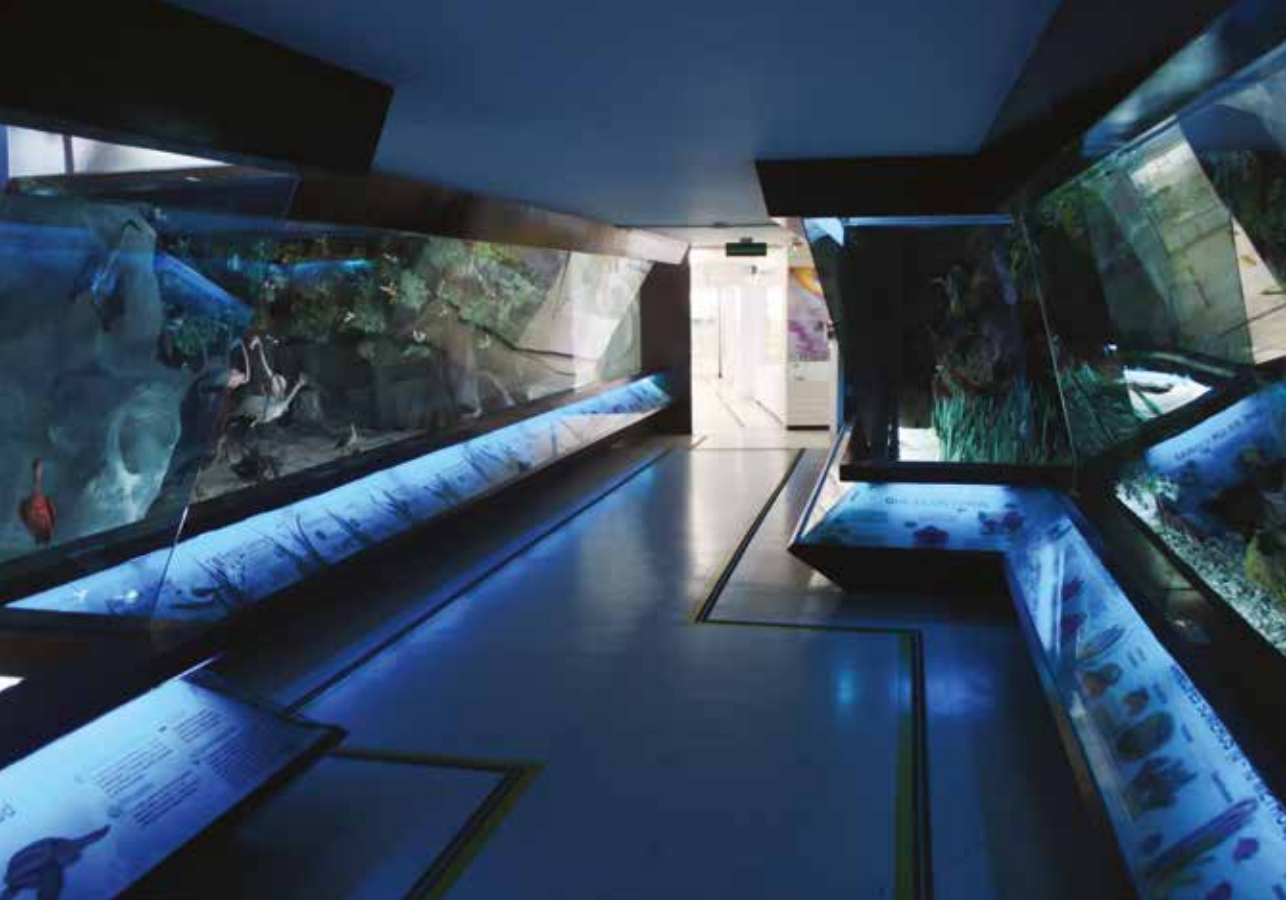
Museo del Mar, Universidad Jorge Tadeo Lozano

Ambos lugares ofrecen al público en general esparcimiento, además de facilitar la divulgación de temas científicos marinos y otras actividades de investigación.