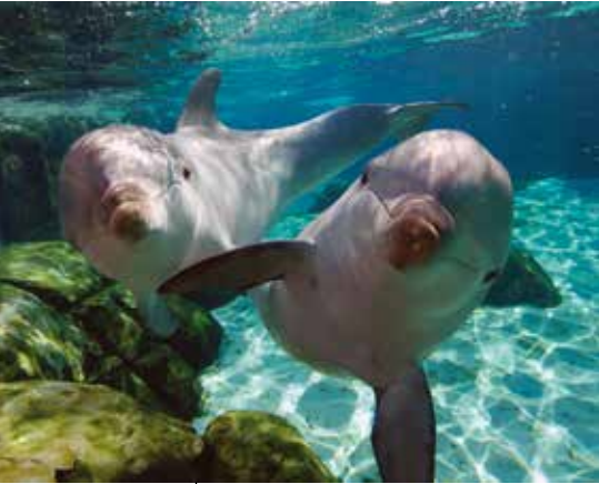
Los delfines, símbolo de la majestuosidad de las especies marinas.

e ingeniería. En la predicción de los impactos del cambio climático sobre las comunidades ecológicas y la capacidad para la adaptación biológica, por ejemplo, se requiere una combinación de datos observables y de análisis de ellos, recurriendo a un modelamiento apropiado. De la colección de datos observables y experimentales, se debe avanzar hacia la generación de conocimiento, empresa en la cual la ciencia teórica y el modelamiento desempeñan un papel central.