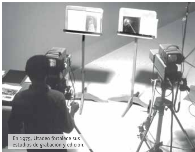
En 1975, Utadeo fortalece sus estudios de grabación y edición.

Fruto del proyecto de Patrimonio Audiovisual, en Utadeo se conformó un fondo compuesto por cerca de 250.000 documentos en audio, fotografía, dibujos, gráficos, películas y videos. Así mismo, a partir de una mirada vanguardista que integra los medios con las nuevas plataformas tecnológicas, desde el 2013 se trabaja en su divulgación y