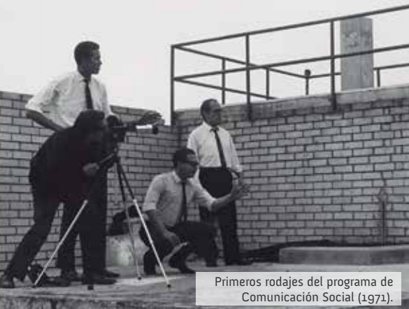
Primeros rodajes del programa de Comunicación Social (1971).

Actualmente se gestionan 200 documentales de la serie Reflejos del programa Nuestros recursos , que emitieron Utadeo e Inravisión.